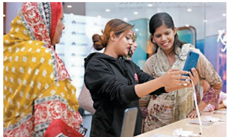
多國關注 Google 可能濫用在手機作業系統上的霸主地位。