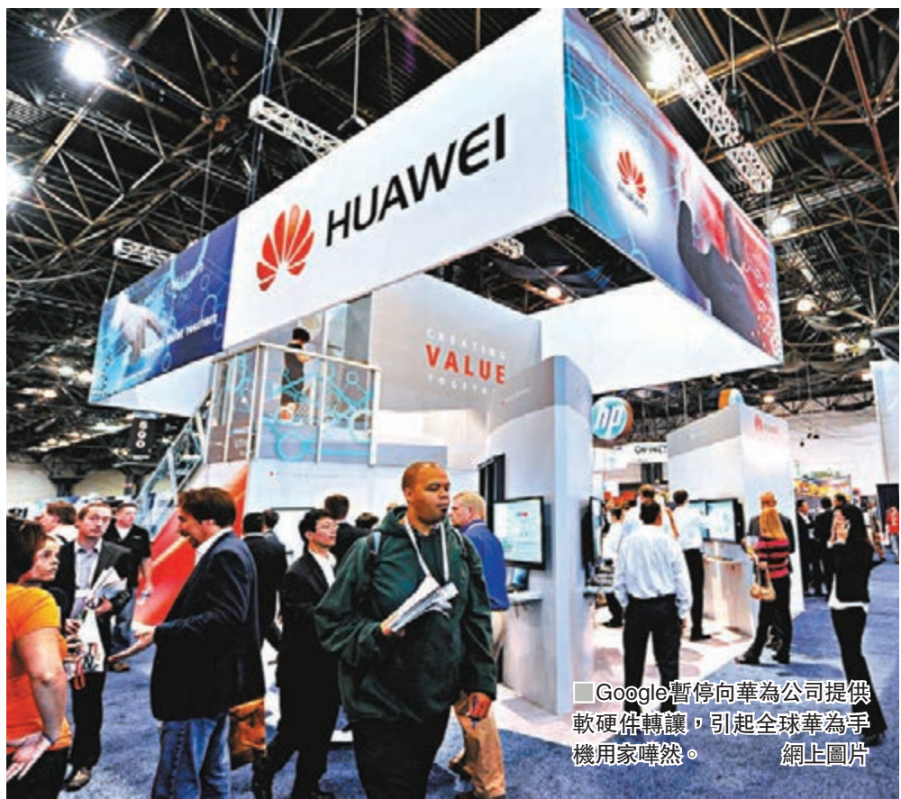
Google 暫停向華為公司提供軟硬件轉讓，引起全球華為手機用家嘩然。

由 Google 主導開發的 Android 定位為開源作業系統，即系統原始碼對外公開，任何開發者都能在基礎版本之上開發各種版本，目的是避免任何企業限制或控制系統發展和創新。Google 會每年定期發佈 Android 系統版本更新，再由各大流動設備廠商根據自身產品需要進行修改。