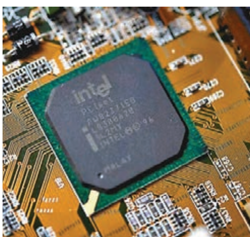
美國許多半導體公司的收入，均依賴中國市場及貿易額。

美國許多半導體公司的收入，均依賴中國市場及貿易額，中美貿易戰對他們造成重大打擊。美光科技是去年資本開支最大的 20 間半導體企業之一，但因需求下降及產品庫存增加，公司首季已削減開支，並調低本財政年度銷售預測。