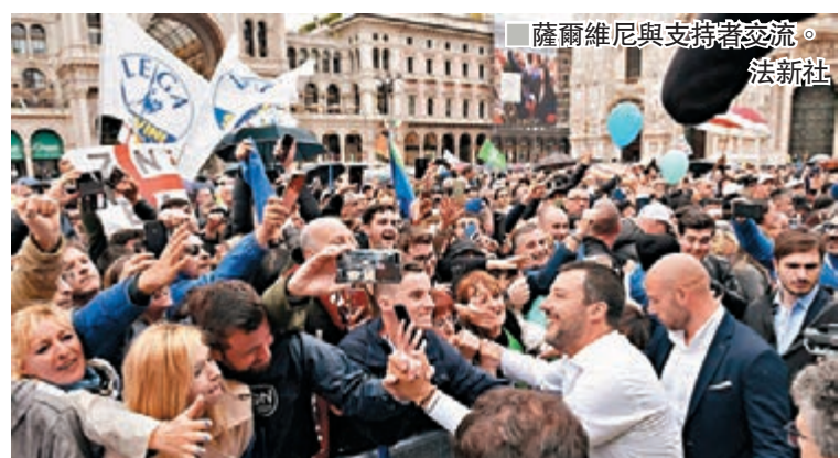
薩爾維尼與支持者交流。

極端主義者、種族主義者或法西斯主義者，「你在這裡不會找到極右人士，只會找到明智的政治家」。他續稱，過去20年來掌管歐洲的政客才是極端主義者，形容他們「非法佔用」成員國。