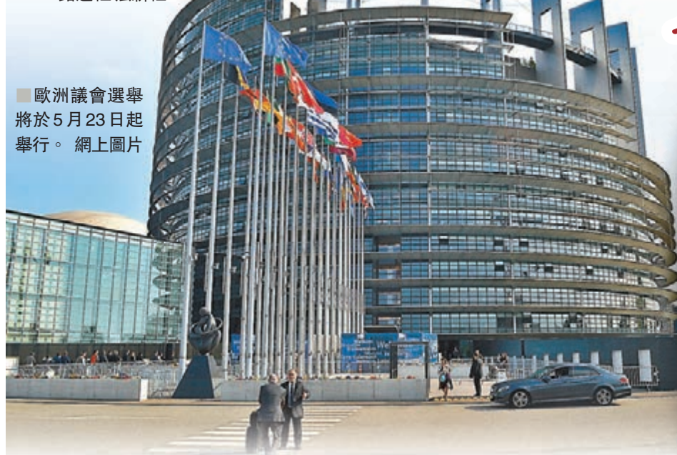
歐洲議會選舉將於5月23日起舉行。