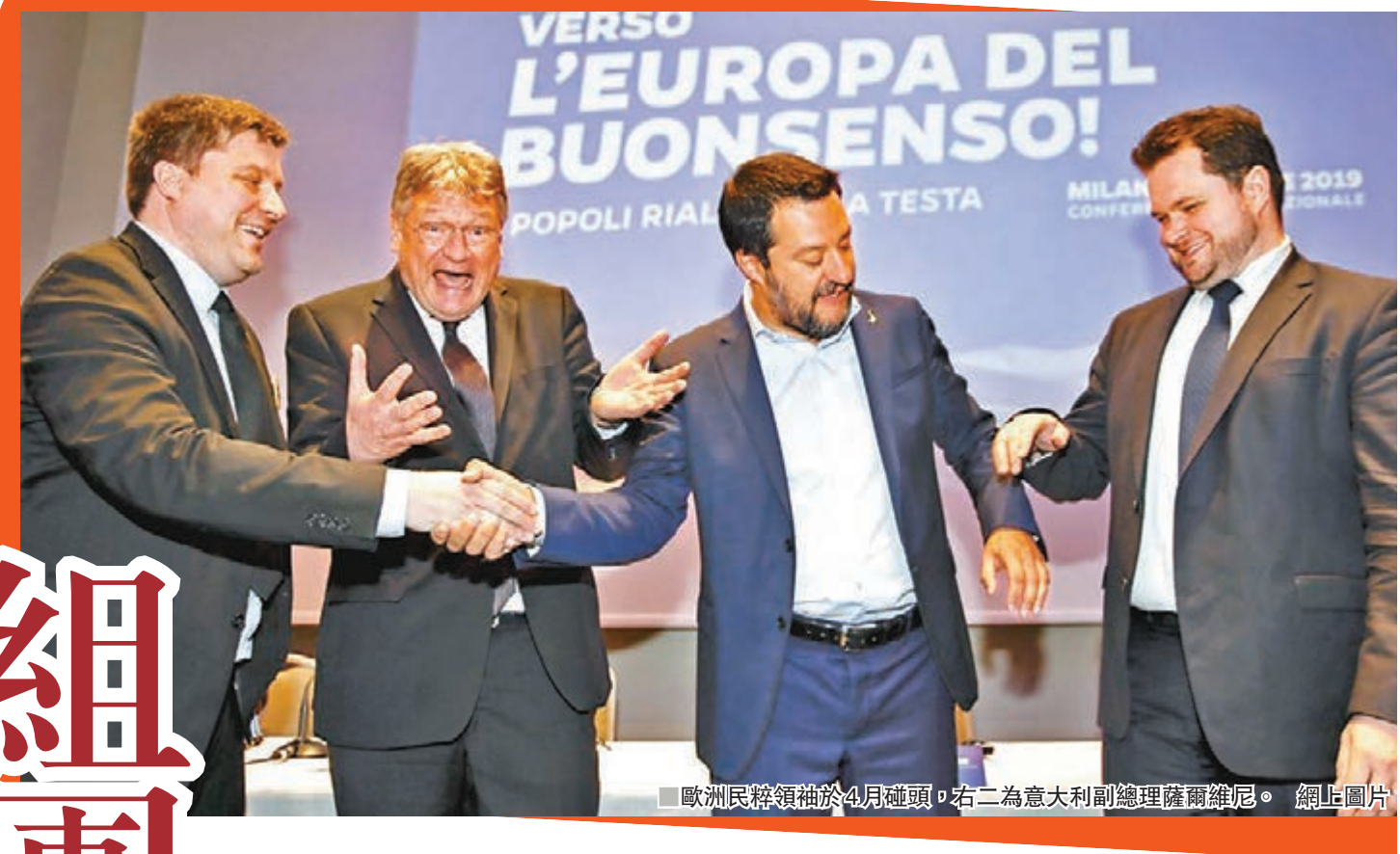
歐洲民粹領袖於4月碰頭，右二為意大利副總理薩爾維尼。網上圖片