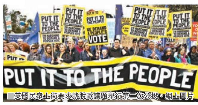
英國民眾上街要求就脫歐議題舉行第二次公投。

另一方面，工黨亦借歐洲議會自我宣傳，在競選單張表明將準備大選，且不排除舉辦第二次脫歐公投。多名親歐派國會議員更組成新政黨「改變英國」(Change UK)，呼籲居英歐盟公