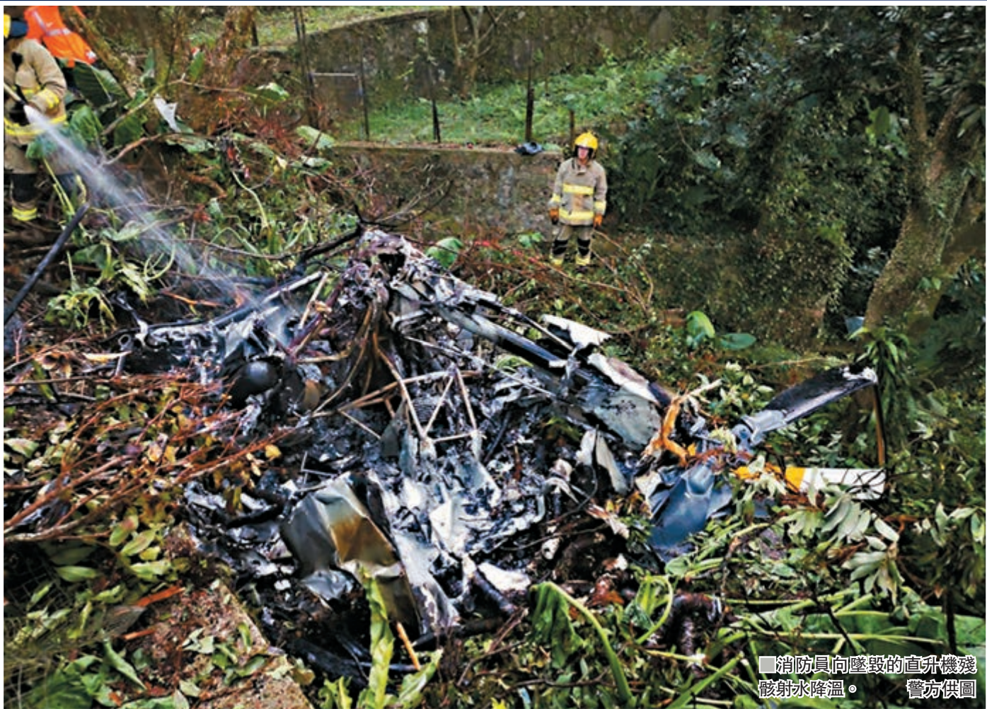
消防員向墜毀的直升機殘骸射水降溫。

本港又再發生直升機墜毀事故，一架私人小型直升機，昨午在石崗機場起飛不到50分鐘，突在八鄉嘉道理農場上空發生爆炸解體，墜落農場山坡起火，機件殘骸散佈方圓約100米，剛獲續駕駛私人直升機牌，任職律師的男機師當場死亡，其中一隻疑屬死者的波鞋落在林錦公路邊。民航處、消防處及警方正循多方面，包括肇事直升機的飛航運作、機件及天氣等，通宵封鎖現場調查事故原因。受事故影響，嘉道理農場今日會關閉。