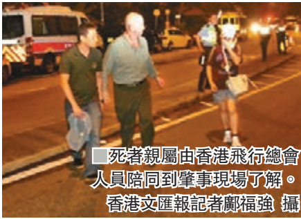
死者親屬由香港飛行總會人員陪同到肇事現場了解。