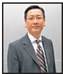
死者王輝雄律師。