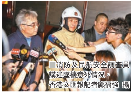
消防及民航安全調查員講述墜機意外情況。