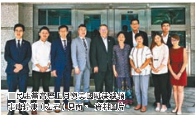
民主黨高層上月與美國駐港總領事唐偉康(左五)見面。

當時，社會上就宣誓相關的法律問題爭論不休，全國人大常委作出了解釋，釐清了基本法第一百零四條，即「香港特別行政區行政長官、主要官員、行政會議成員、立法會議員、各級法院法官和其他司法人員在就職時必須依法宣誓擁護中華人民共和國香港特別行政區基本法，效忠中華人民共和國香港特別行政區」的真正解釋和含意，並指出宣誓是有關公職人員就職的法定條件和必經程序，宣誓人必須真誠、莊重、準確、完整地進行宣誓等。