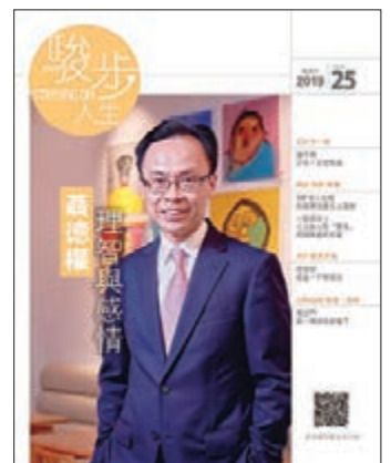
政制及內地事務局長聶德權接受《駿步人生》封面訪問，剖析理智與感情。

香港賽馬會支持出版的《駿步人生》，旨在透過報道社會上的善行美事，並介紹有助解決問題的方法和渠道，為香港社會注入正能量。最新一期已在5月8日出版，政制及內地事務局長聶德權接受《駿步人生》封面訪問，細說少年時代的點滴，包括由蝸居板間房到獲編派公屋單位的童年往事。出身基層，深信有危才有機，造就了今日樂觀的性格。