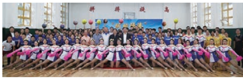
躍動陝港跳繩體育文化交流活動大合照

躍動陝港跳繩體育文化交流活動日前順利完成。活動由中國香港跳繩體育聯合會、陝西省海外聯誼會、西安市海外聯誼會聯合主辦，香港國際城(西安)商業運營管理有限公司協辦，青年事務委員會資助。