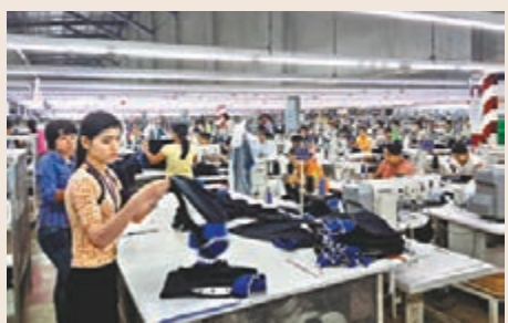
■部分港企已搬至東南亞以避貿戰。

他表示，若美國正式全面徵稅25%，內地對美出口商品佔總出口約五分之一，而出口美國商品總價值約佔內地GDP不到1個百分點，廖群直言，內地經濟和市場必然會有所影響，A股和港股首當其衝。近期人民幣已有下行壓力，他料一旦貶至6.9大關，人行會出手干預，貶值雖然有利於出口，但對市場信心有負面影