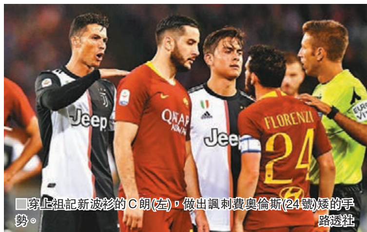
■穿上祖記新波衫的C朗(左)，做出諷刺費奧倫斯(24號)矮的手勢。

祖雲達斯葡萄牙球星基斯坦奴拿度（C朗）在意大利甲組聯賽當地周日作客兩球不敵羅馬之戰，竟於賽中擲揄對手翼鋒費奧倫斯太矮，他似乎也知哀賽後立即道歉。