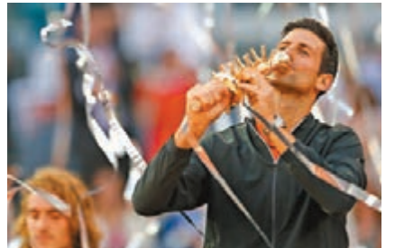
■祖高域親吻獎盃。

馬德里網球賽當地12日決出男單冠軍，頭號種子祖高域直落兩盤擊敗9號種子、希臘新星施斯柏斯，繼2011及2016年第三度於此賽事奪得冠軍。這是祖高域的第74冠，也追平拿度第33次捧起大師賽冠軍獎盃。