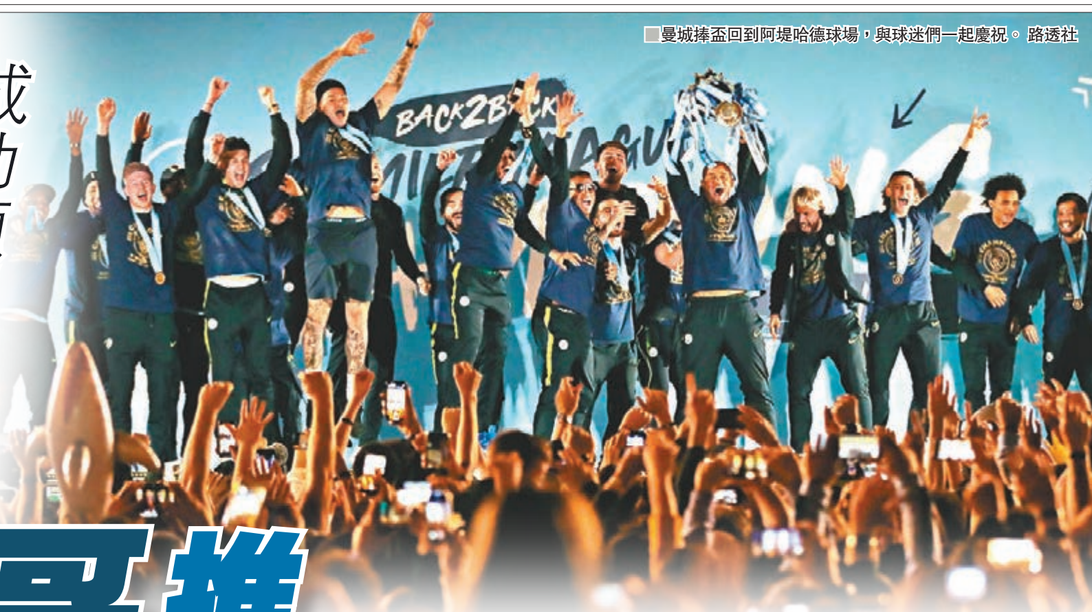
■曼城捧盃回到阿提哈德球場，與球迷們一起慶祝。路透社