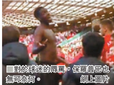
■香港文匯報記者 楊浩然

至於今季一直受傷困擾的曼聯最高薪球星「山神」阿歷斯山齊士，則於網上向球迷道歉：「這是困難的球季，我要向大家道歉，因無論怎樣你們也全力支持我們。但我確信球會很快會重返高峰，像費格遜爵士的年代一樣。」蘇斯克查再次承認已隊與曼城及利物浦有着甚大距離，希望球員在暑假後能以不同的面貌歸隊，努力尋求進步。