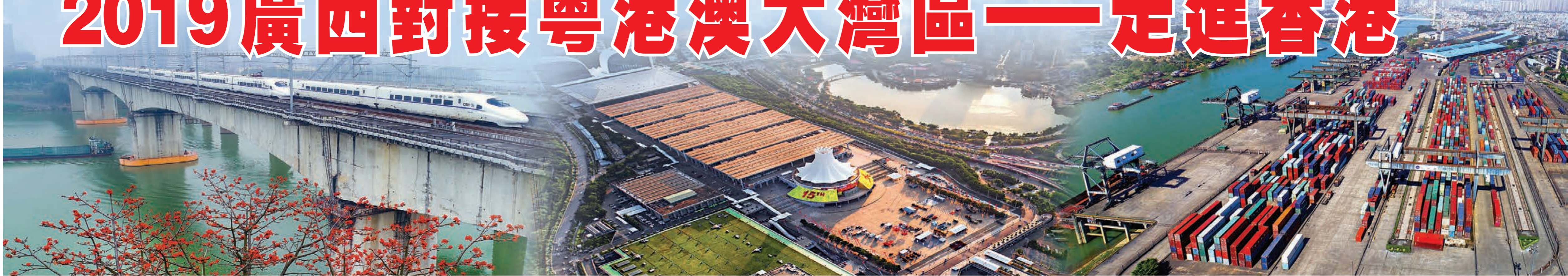
■八桂大地交通基礎設施實現跨越式發展。圖為動車組過邕江