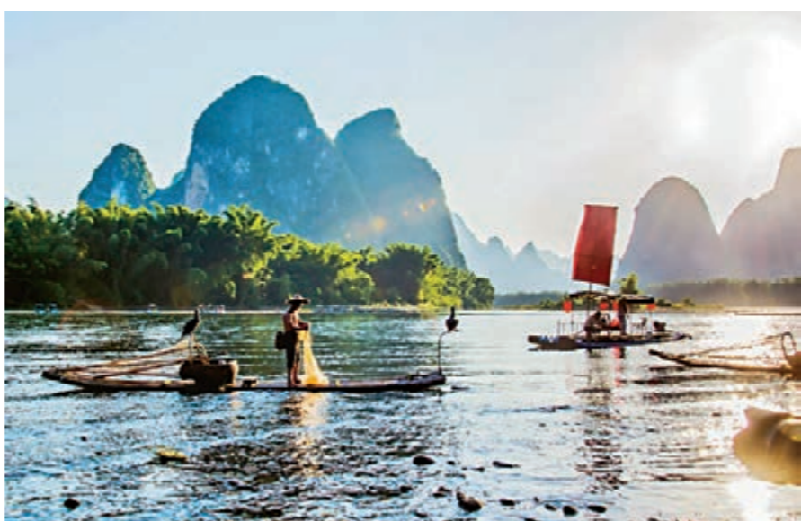
■灕江風光

2018年12月，習近平總書記為廣西壯族自治區成立60周年欣然題詞「建設壯美廣西 共圓復興夢想」，深情寄託了黨中央對廣西站在新起點、創造新輝煌的殷切期望。