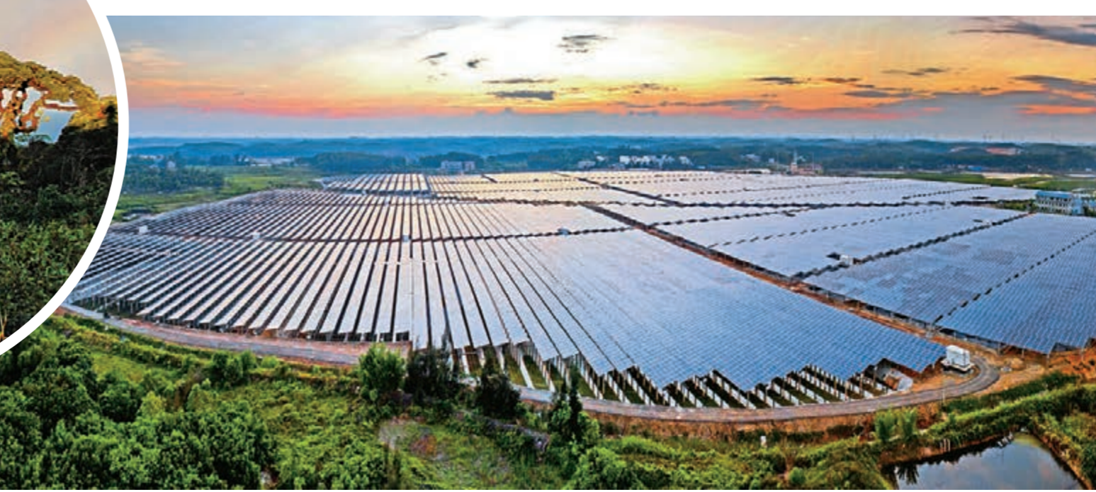
■霞光映照防城港企沙漁光光伏場