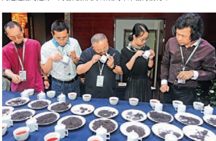
■中國（廣西）六堡茶鬥茶大會

站在新中國成立70周年的嶄新起點上，廣西始終堅持以習近平新時代中國特色社會主義思想為指引，各族幹部群眾攜手追夢，向着更加高遠遼闊的遠方，向着更加美好繁榮的未來奮力前行！