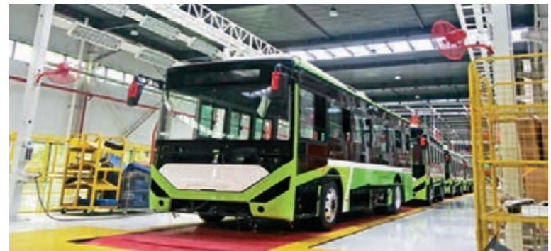
■貴港新能源汽車生產線

風吹拂，廣西張開雙臂擁向世界，地區生產總值在1998年達到1911億元。進入新世紀，廣西發展駛入快車道，地區生產總值2011年首次突破1萬億元，僅過5年，2017年又翻了一番，突破2萬億元。全區主營業務收入超千億元的工業產業增加至10個。