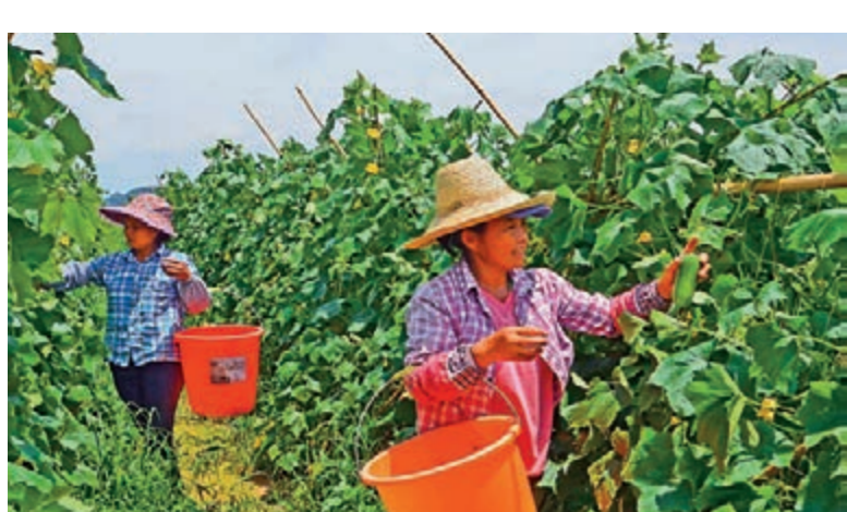
■賀州市八步區鋪門鎮鎖花蔬菜基地菜農在採摘毛節瓜

作為全國脫貧攻堅主戰場之一，這些年來，廣西堅持把脫貧攻堅作為最大政治責任和第一民生工程，用「繡花功夫」落實精準扶貧精準脫貧方略，聚焦解決「兩不愁、三保障」突出問題，全面打擊「攻堅