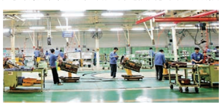
■玉柴集團生產車間

70年來，廣西堅持在發展中保障和改善民生，從群眾最期盼的地方抓起，從最困難的地方入手，實現人民生活由溫飽不足向全面小康邁