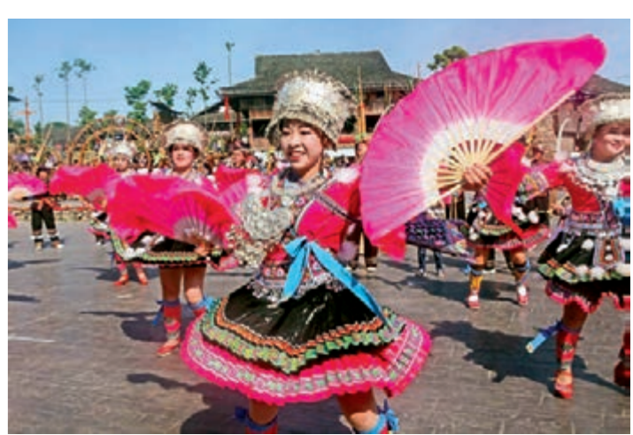
■在粵桂旅遊扶貧合作項目示範點融水苗族自治縣琴嘯苗寨，苗族群眾跳起舞蹈迎賓客