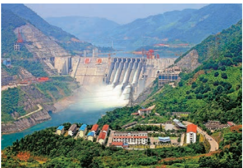
■龍灘水電站