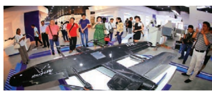
■南寧中關村國家雙創示範基地展示已批量生產的工業無人機