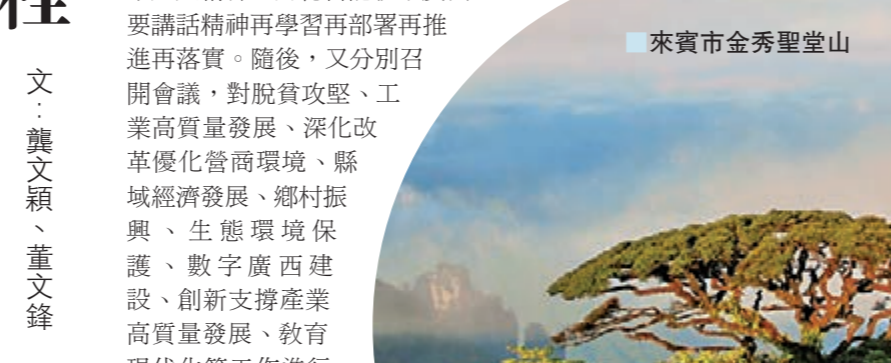
■來賓市金秀聖堂山

去年4月，在習近平總書記視察廣西一周年之際，自治區黨委專門召開十一屆四次全會，深入學習貫徹習近平新時代中國特色社會主義思想和黨的十九大會精神，對總書記視察廣西重要講話精神再學習再部署再推進再落實。隨後，又分別召開全會，對脫貧攻堅、工業高質量發展、深化改革優化營商環境、縣城經濟發展、鄉村振興、生態環境保護、數字廣西建設、創新支撐產業高質量發展、教育現代化等工作進行