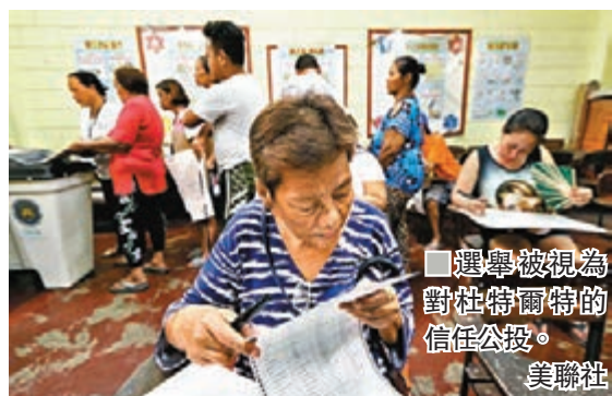
選舉被視為對杜特爾特信任公投。

特爾特推薦的參議院候選人，支持度大多超過反對派候選人，意味杜特爾特有望進一步鞏固權力，推動修憲及恢復死刑等極具爭議法案。