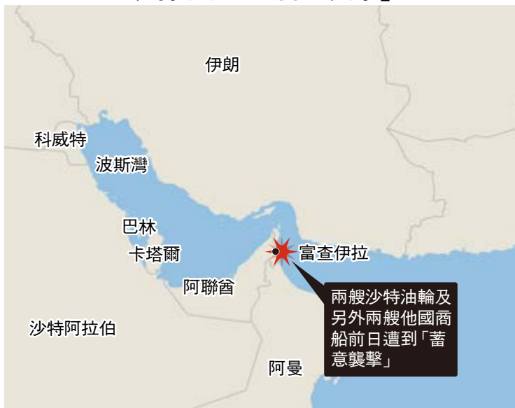
兩艘沙特油輪及另外兩艘他國商船前日遭到「蓄意襲擊」