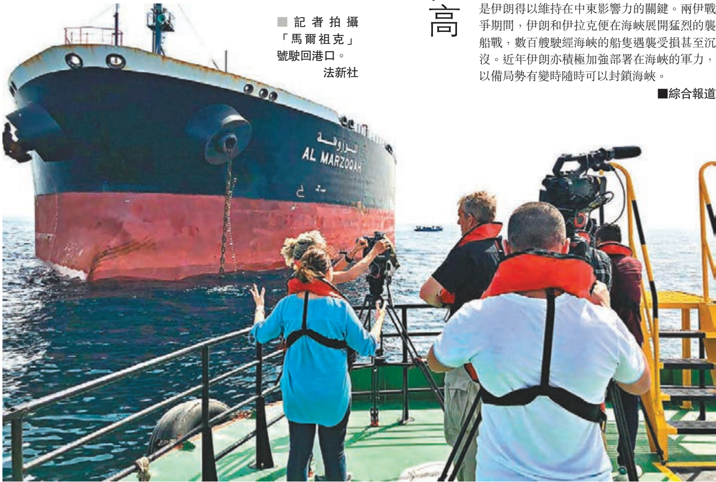
記者拍攝「馬爾祖克」號駛回港口。