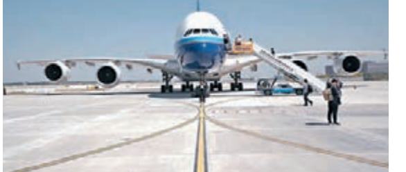
業內人士指，A380成功試飛標誌着大興機場達到機場保障等級要求最高的4F級。

南航在北京大興國際機場擁有40%的時刻資源，未來將承擔北京大興國際機場40%航空旅客業務量。按照發展規劃，到2025年，南航預計在北京大興國際機場投入飛機超過200架，日起降航班超過900班次。