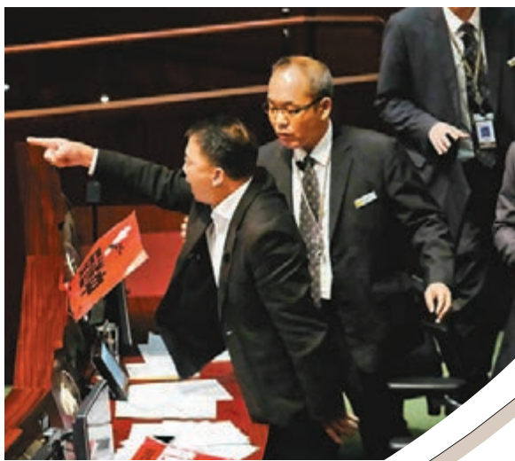
■胡志偉在立法會上指罵特首。資料圖片