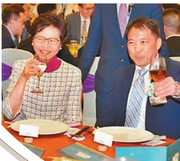
■林鄭去年應邀出席民主黨黨慶，並捐出3萬元。資料圖片

同時，一直予人印象較溫和的胡志偉，竟在上周四的立法會行政長官質詢環節中，瘋狂攻擊林鄭月娥，稱對方「有黨性，有奴性，無血性，無人性」，聲言她「不配做特首」，更爆出「你唔死都冇用呀八婆」的譁眾取寵言論。越走越激的表態，令不少人質疑是「金主吹雞、鴿黨跪低」。