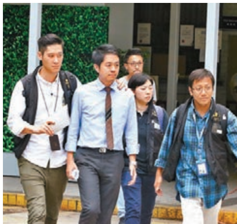
■因強搶手機事件，許智峯被警放扣查。

雖然民主黨立法會議員許智峯過往都有搗亂會議、涉及暴力的舉動，但去年4月他在立法會強搶保安局女EO（行政主任）手機一事，令其醜陋一面在公眾面前無所遁形後，本來不肯道歉的許智峯，在民主黨領導層的介入下，最終還是向傳媒「認謫」。