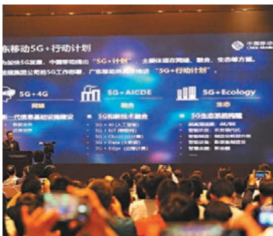
中國移動今年投入2億元人民幣在交通、旅遊、氣象等行業大數據的研發上。圖為第四屆5G和未來網絡戰略研討會。