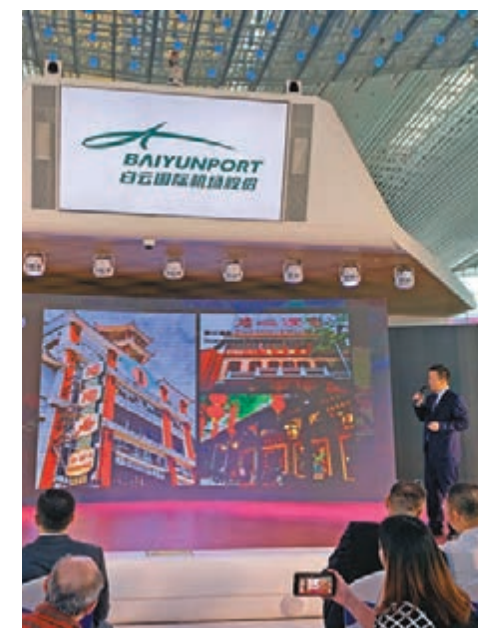
相關部門向外籍遊客推介特色旅遊產品。

為防止境外疫情傳入,該機場海關還在T2航站樓設有32條智能體溫檢測通道,可對進出境旅客實施一對一遙感測溫;不僅測量精度高,且無需旅客停留。該設備在4月3日就曾檢出一例輸入性麻疹病毒核酸陽性病例,是海關總署發佈防止麻疹疫情傳入中國的警示通報以來首宗病例。