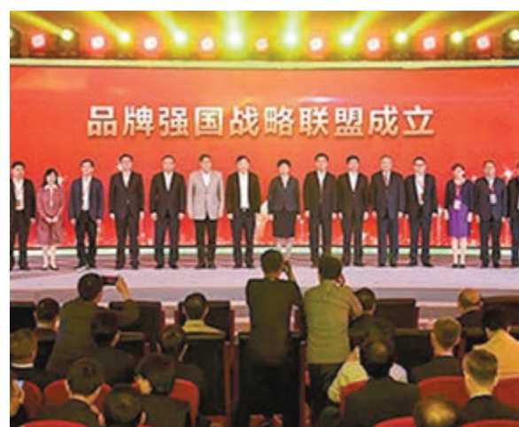
千餘家成員單位參與的品牌強國戰略聯盟5月10日在北京成立。

在當今世界,20%的國際知名品牌佔據了80%的市場份額。誰打出知名品牌,誰就佔據了行業制高點。改革開放以來,中國企業不斷走向世界,一批知名品牌脫穎而出,美譽度影響力持續提升,日益成為展現當代中國開放自信形象、中國人民奮發進取風貌的重要窗口。專家同時認為,與一流品牌強國相比,中國企業還有較大距離,品牌建設速度仍然落後於經濟增長速度,國際知名品牌數量還不夠多、實力還不夠強,中國品牌還蘊藏著巨大的爆發潛力,需要我們加快實施品牌戰略,奮力打造國際一流的中國品牌。