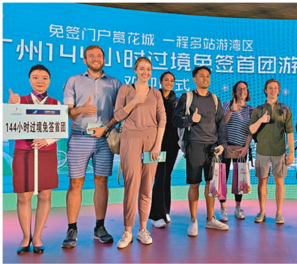
144小時過境免簽政策實施後的首團外籍遊客對新政策所帶來的旅行機會感到滿意。

為了讓外籍遊客更便捷地了解新政策並在廣州遊玩,廣州市文化廣電旅遊局推出了《廣州144小時過境免簽旅遊指南》,提供新政解讀、免簽問答和免簽流程等信息,並推出粵港澳大灣區文化風情遊等5條過境旅遊路線。