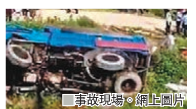
事故現場。

香港文匯報訊 據新華社報道,浙江省溫嶺市松門鎮昨日發生一起農用車側翻事故,已致12死11傷,受傷人員正在醫院救治中。昨日下午1時55分,該市110指揮中心接到報警稱,位於松門鎮甘嶼山半腰山路處一農用車發生側翻。