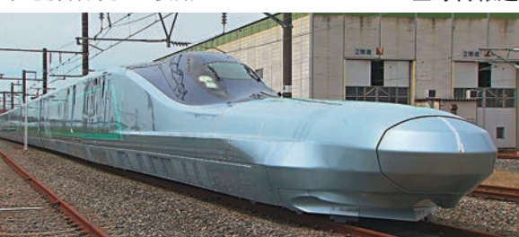
新列車預計於 2031 年投入使用。