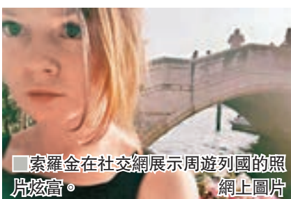
索羅金在社交網展示周遊列國的相片炫富。

隨着索羅金深入上流圈子，她也變得愈來愈大膽，甚至想到建立一所兼營畫廊的夜場，並企圖以此向銀行尋求 2,200 萬美元貸款，不過最終只有一間銀行受騙借出 10 萬美元(約 78 萬港元)。