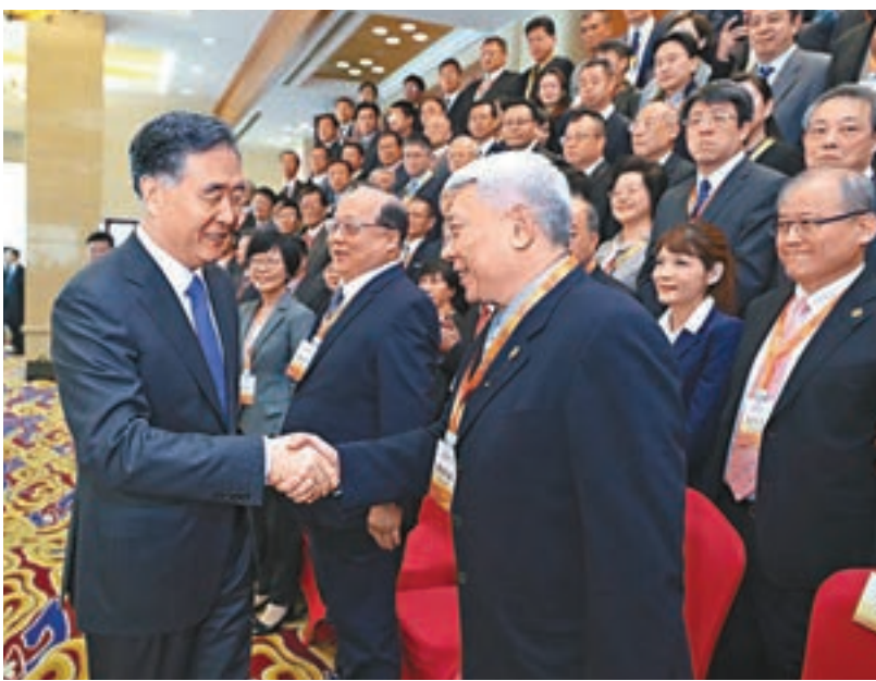
■昨日，中共中央政治局常委、全國政協主席汪洋(左)在北京會見參加「第四屆兩岸媒體人北京峰會」的兩岸新聞媒體代表。

中共北京市委副書記、市長陳吉寧表示，兩岸新聞媒體的交流合作為兩岸同胞加深相互理解、增進互信認同發揮了重要的橋樑紐帶作用，為推動兩岸關係和平發展營造了良好氛圍。