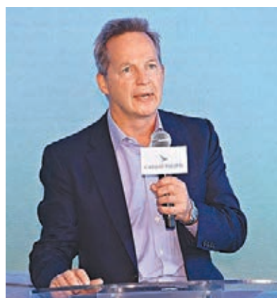
■何果坦言今年貨運需求較去年有所下跌。

香港文匯報訊(記者 周曉菁)中美貿易局勢嚴峻,國泰航空(0293)行政總裁何果昨於公司新口號「志在飛躍 MOVE