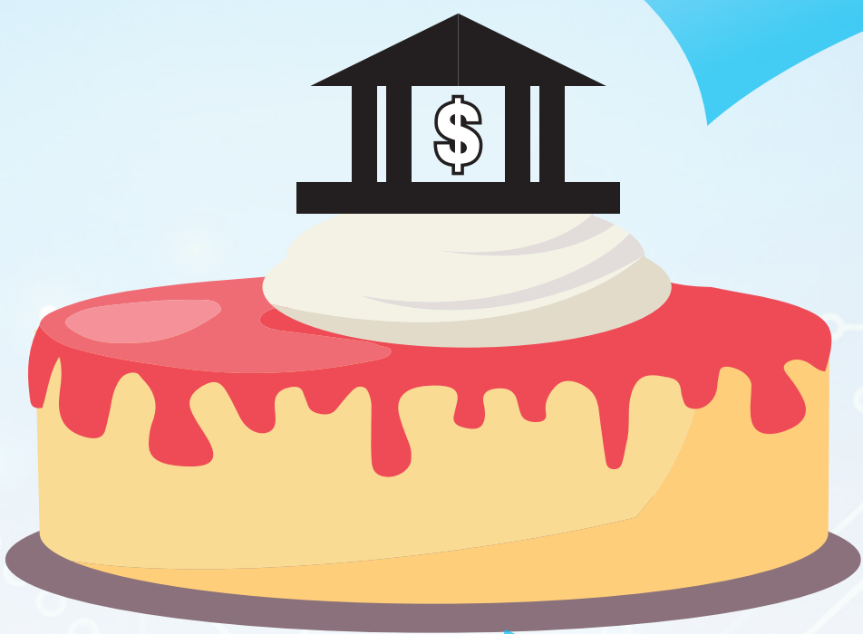
製表：香港文匯報記者 馬翠媚