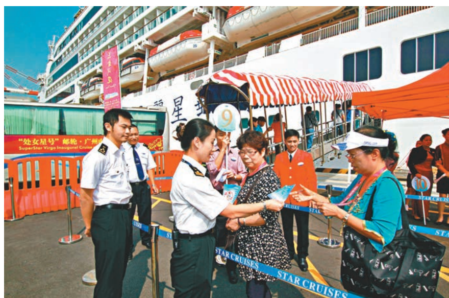
中國郵輪市場潛力巨大。圖為廣州旅客參加郵輪旅遊。

香港文匯報訊（記者 敖敏輝 廣州報道）昨日，在世界港口大會主題為「中國和世界新興郵輪市場」的論壇上，業界代表一致看好中國郵輪旅遊市場，特別是在粵港澳大灣區內，隨著廣州南沙郵輪母港於今年10月啟用，穗港深三大郵輪母港聯動作用將十分顯著，將帶動郵輪遊大幅增長。目前，與其他國家和地區相比，大灣區發展郵輪產業，最大掣肘之一是免簽政策尚未落實，業界期待相關措施儘快推出。