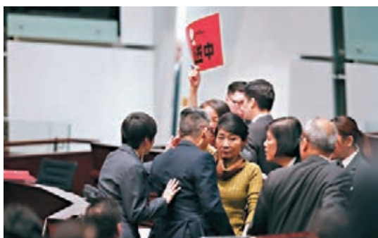
毛孟靜人身攻擊特首。