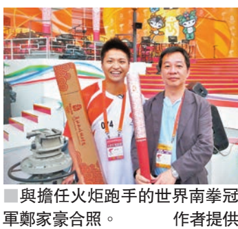
與擔任火炬跑手的世界南拳冠軍鄭家豪合照。