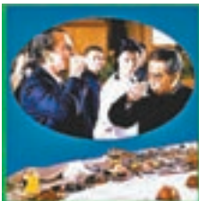
國宴冷盤中，閃現松花蛋。