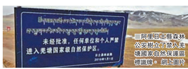
阿里日土縣森林公安樹立了禁入羌塘國家自然保護區標識牌。