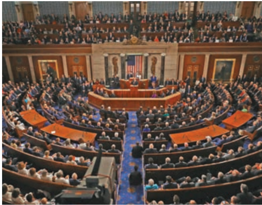
美國聯邦眾議院(圖)當地時間7日通過《2019年台灣保證法》,中方隨即表示堅決反對。

專家:勢加劇台海緊張 對此,北京聯合大學台灣研究兩關係研究所所長朱松嶺對香港文匯報表示,美國眾議院最新通過的兩法案,是對中國內政的嚴重干涉,是對台海問題導向的嚴重誤導,同時也是對島內「台獨」勢力的撐腰打氣。 朱松嶺提醒指出,美國眾議院在中美貿易談判的關鍵時刻,在台灣島內、尤