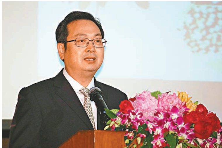
雲南「2019香港知名企業家午餐會」昨在港舉行。圖為雲南副省長張國華。

香港文匯報訊（記者 周曉菁）雲南「2019香港知名企業家午餐會」昨日在港舉行，雲南副省長張國華就加強兩地重點領域合作、推進「一帶一路」發展發表演講，他呼籲大家充分發揮香港資本、市場的優勢，投入資金、技術和管理，加入雲南的八大重點產業發展，共同打造世界一流的「三張牌」，努力實現取長補短，相互促進，互利共贏。