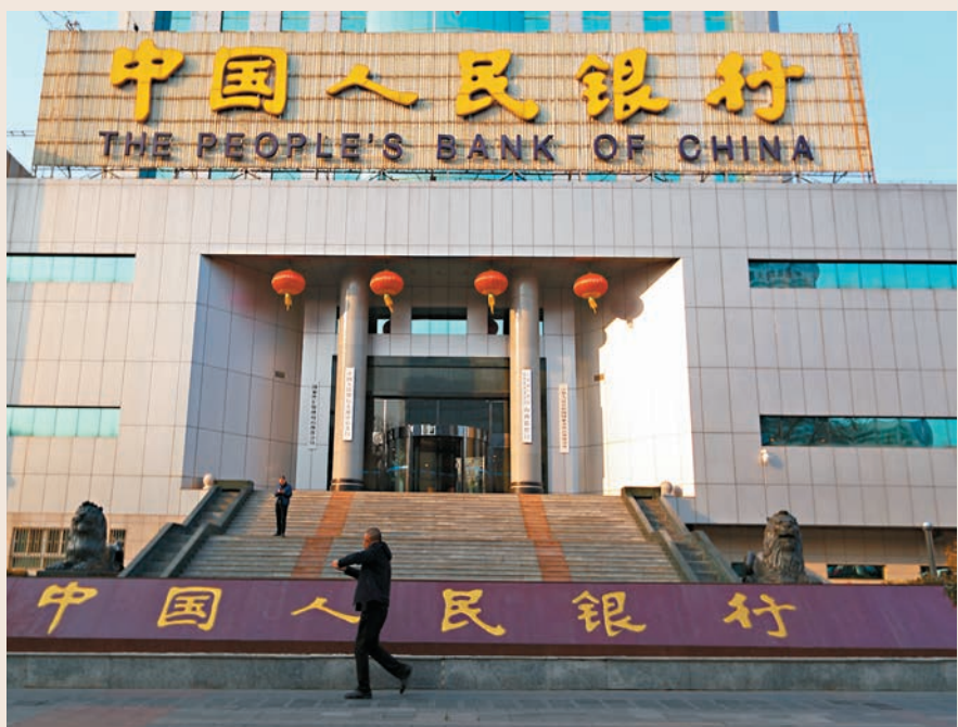
4月中國外匯儲備為3.09萬億美元，較上個月減少38億美元，結束了連續5個月的升勢。資料圖片

國家外匯管理局新聞發言人、總經濟師王春英表示，4月外匯市場運行保持平穩，國際金融市場上，美元指數略升0.2%，全球債券指數基本持平，匯率折算和資產價格變化等因素綜合作用，導致外匯儲備規模略有下降。