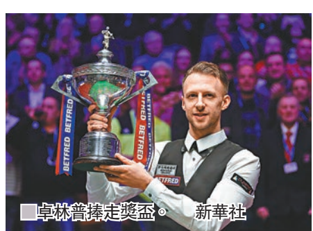
卓林普捧走獎盃。

本屆世界桌球錦標賽昨日圓滿結束，英格蘭球手卓林普決賽以局數18:9勇挫蘇格蘭名將希堅斯，首次贏得世錦賽冠軍，並完成桌壇「大滿貫」。