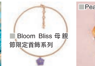
■Bloom Bliss 母親節限定首飾系列