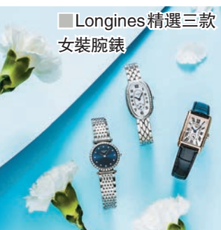
■Longines 精選三款女裝腕錶

而 Swatch 則全新推出2019 母親節特別款 FIORE DI MAGGIO 腕錶，配精美的日暉紋錶盤，其間盛開的典雅花朵對應着不同