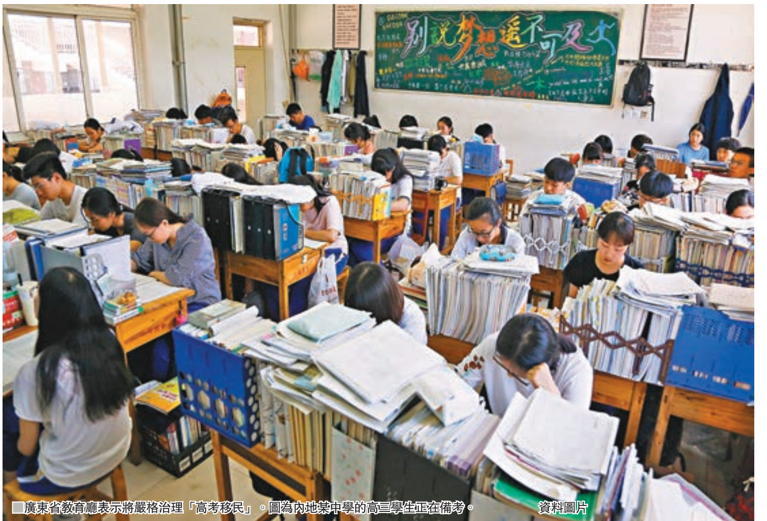
廣東省教育廳表示將嚴格治理「高考移民」。圖為內地某中學的高三學生正在備考。