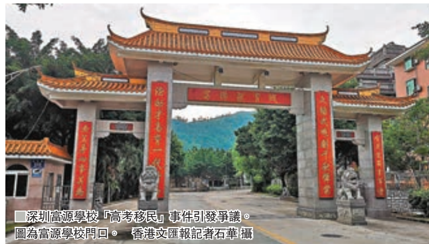
深圳富源學校「高考移民」事件引發爭議。圖為富源學校門口。

香港文匯報訊（記者 石華 深圳報道）網上近日流傳出一份深圳市高三年級第二次模擬考試成績單，讓人驚奇的是一所民辦學校——富源學校異軍突起，在前十名單裡，富源學校獨佔6席，而深圳四大高中總和也只有4席。不少家長質疑這是富源學校從河北引入了高考考生，要求有關部門徹查。深圳市有關部門最新證實，富源學校進入此次「二模」前100名的學生中，有10餘名學生均從河北衡水第一中學轉入。目前深圳市已成立專項工作小組進行調查，廣東省教育廳5日也下發通知要求各地成立「高考移民」專項行動工作組，對外省轉入生轉學條件進行排查。對存在「高考移民」的學校，嚴重者將吊銷辦學執照。