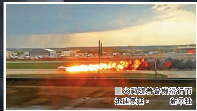
火勢隨着客機滑行而迅速蔓延。

俄國空難 編號「SU1492」蘇霍伊超級噴射機飛行路線 客機從莫斯科出發往摩爾曼斯克，起飛不久後折返，硬著陸時起火