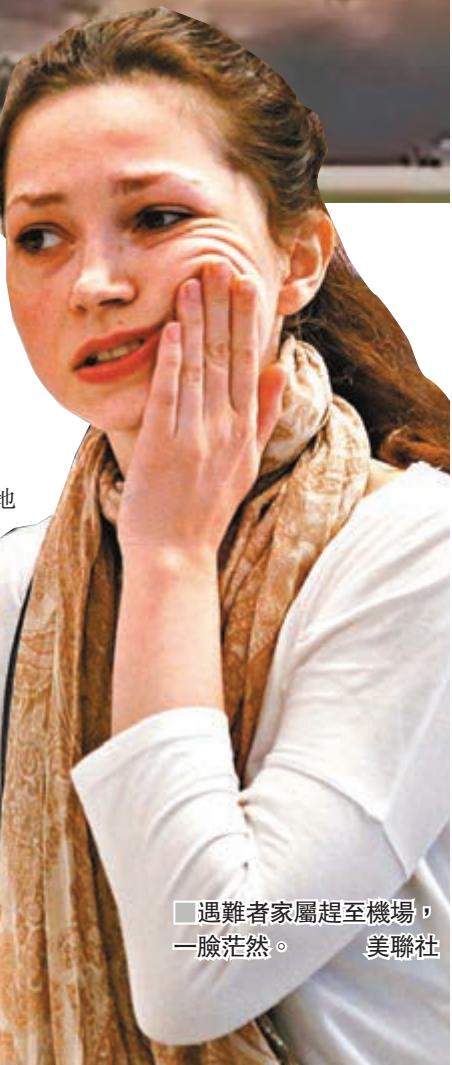
遇難者家屬趕至機場，一臉茫然。

肇事客機折返降落期間，多次碰撞跑道，懷疑因此令油缸損毀，引發猛烈大火。該客機機長葉夫多基莫夫事後接受訪問，透露客機當時油缸全滿，安全著陸的難度大增，但聲稱降落過程大致平穩，然而客機著地一刻因猛烈碰撞，導致起落架斷裂，或因此令客機起火。 葉夫多基莫夫表示，客機起飛不久後被閃電擊中，機師一度與地面中斷通訊，「機組人員在別無選擇下，決定按照飛行指引，以人手操作降落」。客機其後恢復有