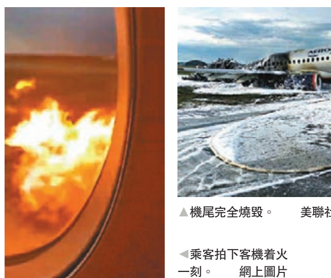
機尾完全燒毀。

俄羅斯國際航空公司早年的飛行安全紀錄備受詬病，英媒去年統計顯示，歷來涉及俄航的空難，已導致逾8,231名乘客喪生，較排第二的法國航空多近6,500人，是全球航空公司中最高。近期安全情況雖有所改善，但今次空難再令各方關注其安全問題。 1994年6港人罹難 在1994年3月，俄航一架由莫斯科飛香港的客機，在西伯利亞 上空失速墜下，最終撞山墜毀，機上75人全部罹難，當中包括6名港人。 今次發生空難的蘇霍伊超級100型雙引擎噴氣式客機，是俄國首款以西方適航標準設計的民航機，亦是後蘇聯時期俄國生產的首款客機，由俄國聯合航空製造公司及美國波音公司共同研製，於2011年推出，在俄國廣泛採用，多用作替換過時的蘇聯時代客機，但國際口碑一般，2012年一架同型號客機在印尼撞山墜毀，機上45人全部遇難。而這款客機更曾因水平穩定器被發現有缺陷，2016年一度被禁飛。 俄國聯合航空製造公司由俄國政府聯同蘇霍伊集團等多間民用及軍用飛機生產商組成，俄國政府曾表示有意購買更多此款客機，支持當地民航業務。有俄國官員表示，現在談論禁飛是言之尚早。 ■綜合報道