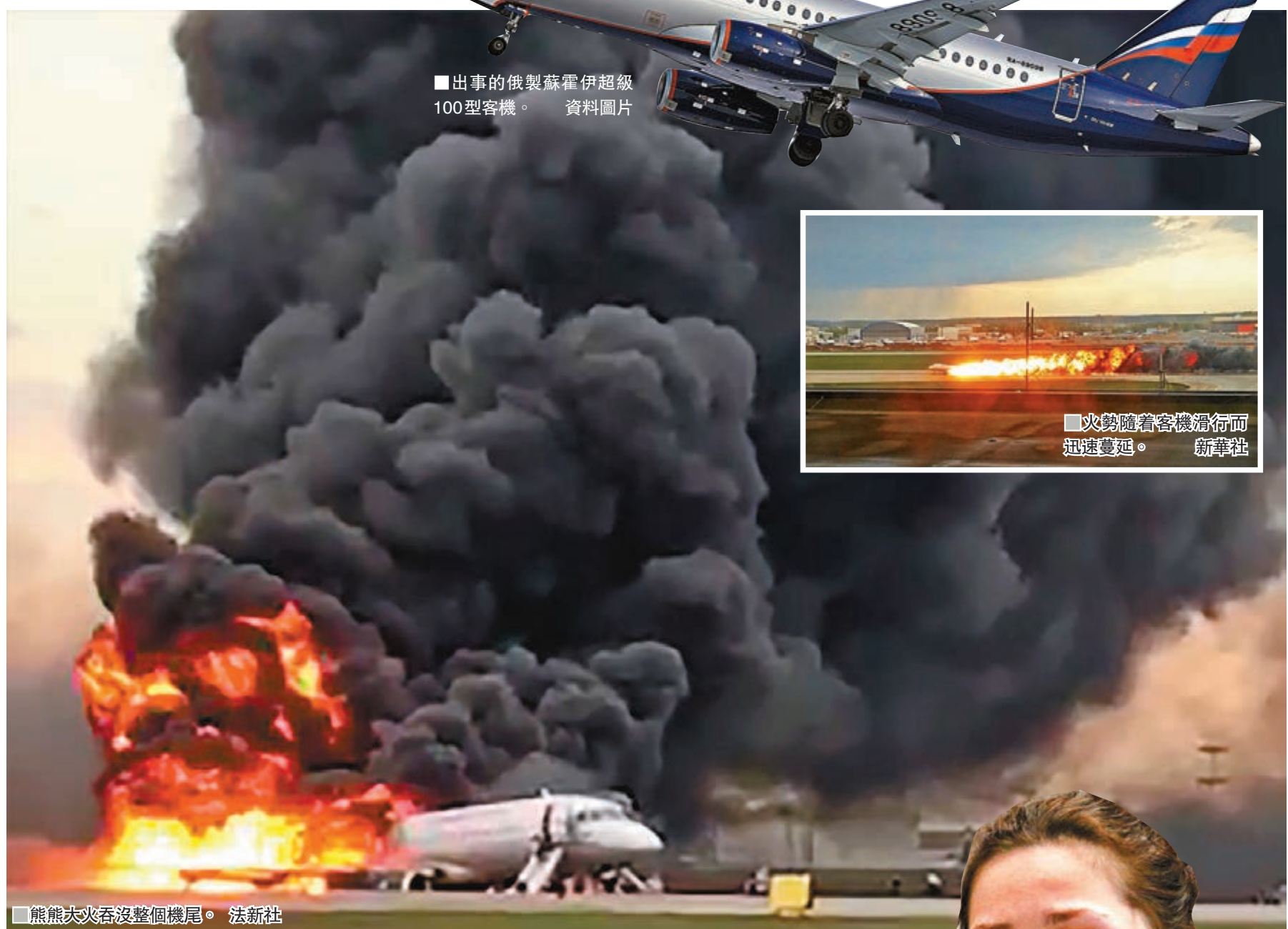
熊熊大火吞沒整個機尾。