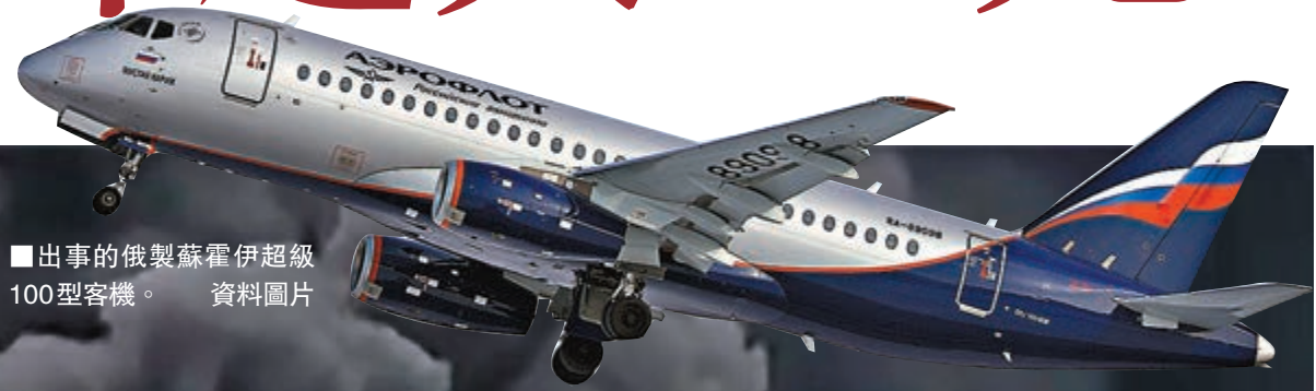
出事的俄製蘇霍伊超級100型客機。資料圖片