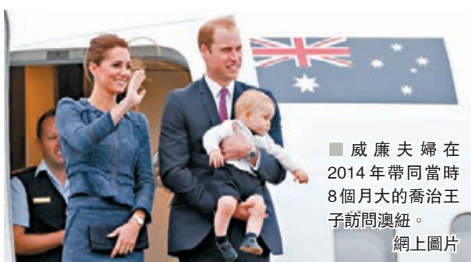
威廉夫婦在2014年帶同當時8個月大的喬治王子訪問澳洲。網上圖片