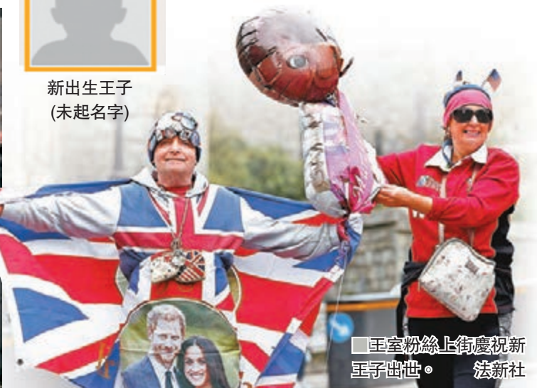
王室粉絲上街慶祝新王子出世。