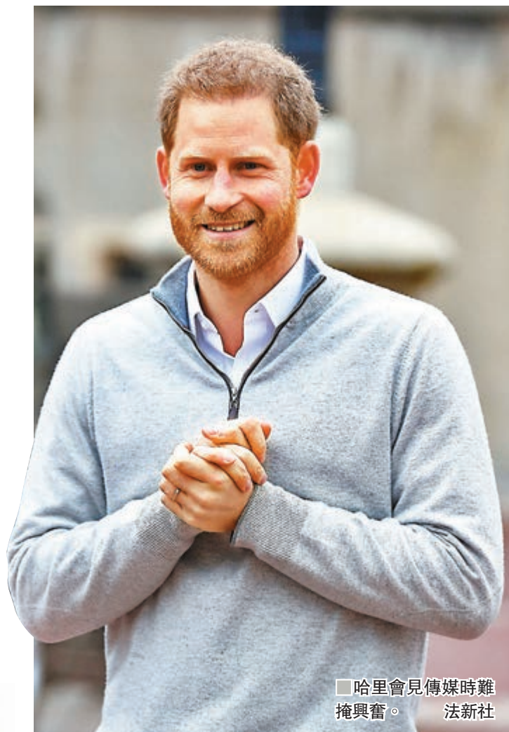
哈里會見傳媒時難掩興奮。