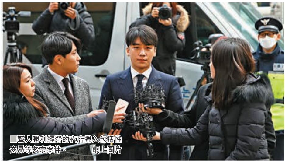
藝人勝利經營的夜店捲入包括性交易等多宗案件。

婦女勞工法律援助中心指出，非法拍攝的色情影片，充斥社會上不同層面，絕對不止名人和明星，在韓國由男性主導的傳統風氣下，女性往往不敢聲張。