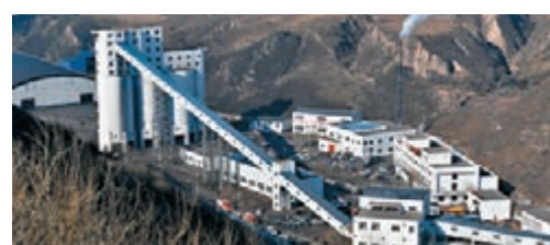
2019年,內地計劃關閉1,000座以上不具備安全生產條件的非煤礦山。圖為日前陝西百吉礦業「1·12」重大事故現場。