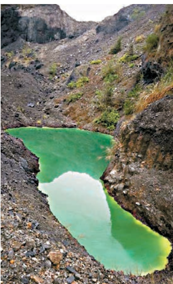
湖南省益陽市石煤礦山環境污染和生態破壞嚴重,威脅洞庭湖及長江生態。圖為湖南洞口縣楊林石煤礦礦坑廢水。

督察組指出,益陽市對石煤礦山環境污染問題重視不夠,部署推進不力,監督管理不到位。桃江縣政府及其部門在督察組現場檢查期間放任企業弄虛作假,應對督察。赫山區個別公職人員充當「保護傘」,對相關礦業公司涉嫌環境犯罪行為,案發前包庇掩飾,上級介入後以罰代管,督察督辦後拒不移送。