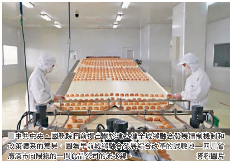
中共中央、國務院日前提出關於建立健全城鄉融合發展體制機制和政策體系的意見。圖為早前城鄉融合發展綜合改革的試驗地——四川省廣漢市向陽鎮的一間食品公司的流水線。

香港文匯報訊 據央視新聞客戶端報道,中共中央、國務院日前提出關於建立健全城鄉融合發展體制機制和政策體系的意見。