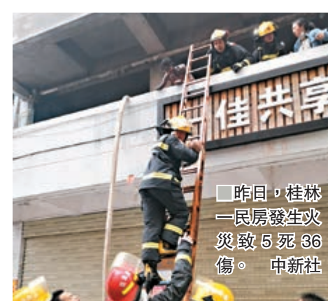
昨日,桂林一民房發生火災致5死36傷。中新社

香港文匯報訊 據中新社報道,昨日6時許,廣西桂林市雁山區雁山鎮西龍村一村民自建出租房發生火災,已造成5人死亡。根據雁山區委宣傳部18時通報,經初步核實,死傷人員部分為在校大學生,目前該出租房房主和經營者已被警方控制。