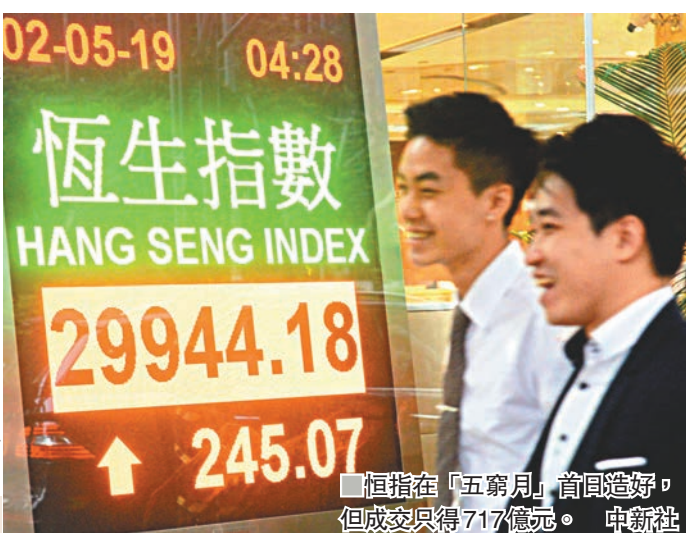
恒指在「五窮月」首日造好,但成交只得717億元。

香港文匯報訊(記者 周紹基)美國昨日一如市場預期不加息,聯儲局官員言論更令市場對美國今年減息的憧憬降溫,一度使港股下跌56點。但中午左右傳出中美很可能在下周五達成貿易協議,市況很快調頭回升,並愈升愈有,令恒指在「五窮月」首日造好。此外,港股過去4個月走高,也令市民的強積金回報平均達到4.05%,單是4月份,本港強積金平均回報則為1.36%,市民在4月人均賺3,892元。