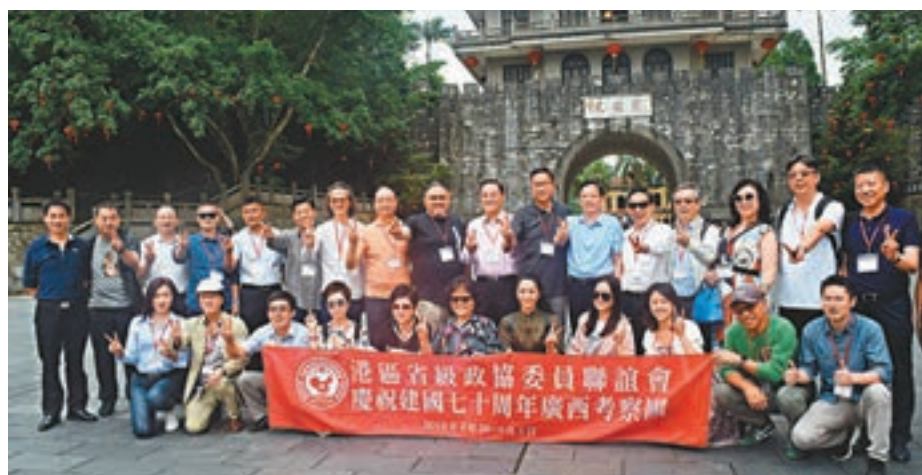
考察團成員於友誼團合影。

他介紹,聯誼會成立於2006年,是香港愛國愛港的重要力量,會內匯聚各行各業精英,各級委員發揮雙重積極作用,包括招商引資、支持特區政府依法施政等,希望各領導多多提點及指導,為香港的繁榮穩定作出貢獻。