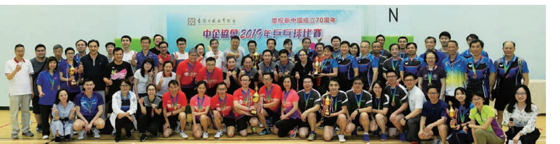
中企協會2019年乒乓球比賽圓滿結束

參加本次比賽的共有41家中資企業,以及中聯辦及外交公署代表隊,是中企協會歷年組織的乒乓球比賽參賽隊伍最多的一次,參賽隊員有400多人。參與活動的協會文體委工作人員、香港乒總裁判及公