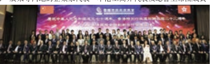
香港中華工商總會第五屆理事會就職宴主合照

日前,慶祝中華人民共和國成立七十周年、香港特別行政區回歸祖國二十周年,2019香港國際金融創新合作發展論壇、香港中華工商總會第五屆理事會就職典禮在龍堡國際酒店成功舉行。全國人大常委譚耀宗,全國政協委員、香港特別行政區政府行政會議成員、立法會議員林健鋒,商務及經濟發展局副局長陳百里等受邀主禮。美國、埃及、土耳其等十餘國家駐香港總領事館總領事或商務官員,來自上海、廣東等內地的企業家代表、本港工商界代表及總會主席團成員、