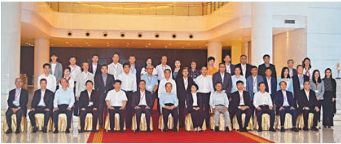
考察團一行與鹿心社等合影。

香港文匯報訊(記者 李擘)港區省級政協委員聯誼會主席鄭翔玲及會長施榮懷4月28日至5月1日率團到廣西參觀考察。其間,廣西壯族自治區黨委書記、人大常委主任鹿心社在南寧會見考察團一行。鹿心社指出,桂港兩地交往進入歷史最好時期,希望聯誼會可以在助力廣西對接融入粵港澳大灣區建設等方面貢獻力量。