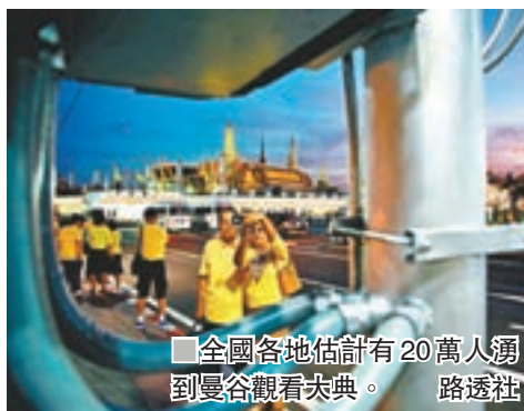
全國各地估計有20萬人湧到曼谷觀看大典。