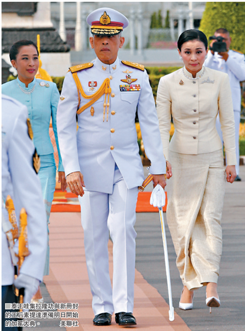
泰王哇集拉隆功與新冊封的皇后素提達準備明日開始的加冕大典。

大典期間，大皇宮附近40條道路需要封閉。當局安排免費巴士、鐵路及渡輪服務供以全國民眾前往曼谷，並提供泰王名義準備的免費膳食，其中周一更會派發印有王徽的樽裝水、食物盒及紀念襟章。因應大批民眾湧入曼谷，酒店房間不敷應用，當局特別開放兩個體育館及公園供民眾住宿。■綜合報道