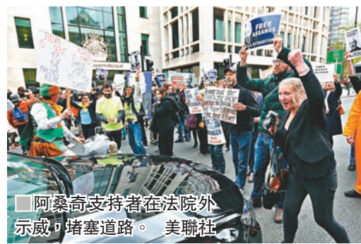
阿桑奇支持者在法院外示威，堵塞道路。