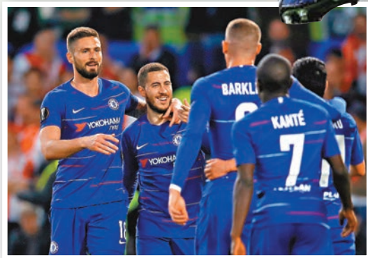
車路士「雙特」夏薩特(左二)和基奧特(左)，此戰力爭幫球隊先取作客入球。路透社