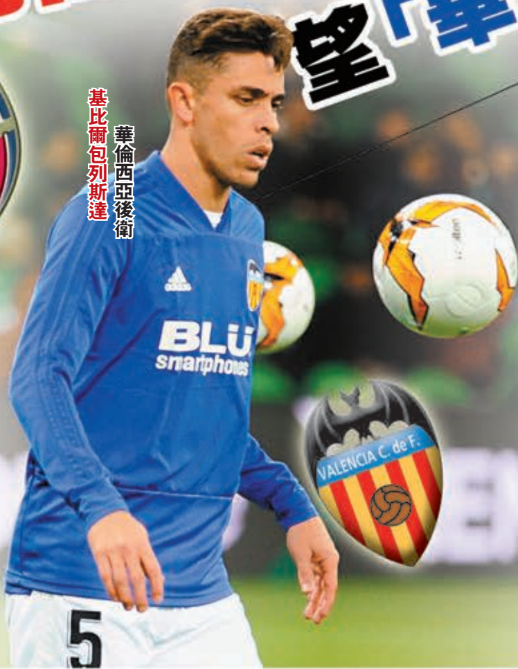
華倫西亞後衛 基比爾包列斯達