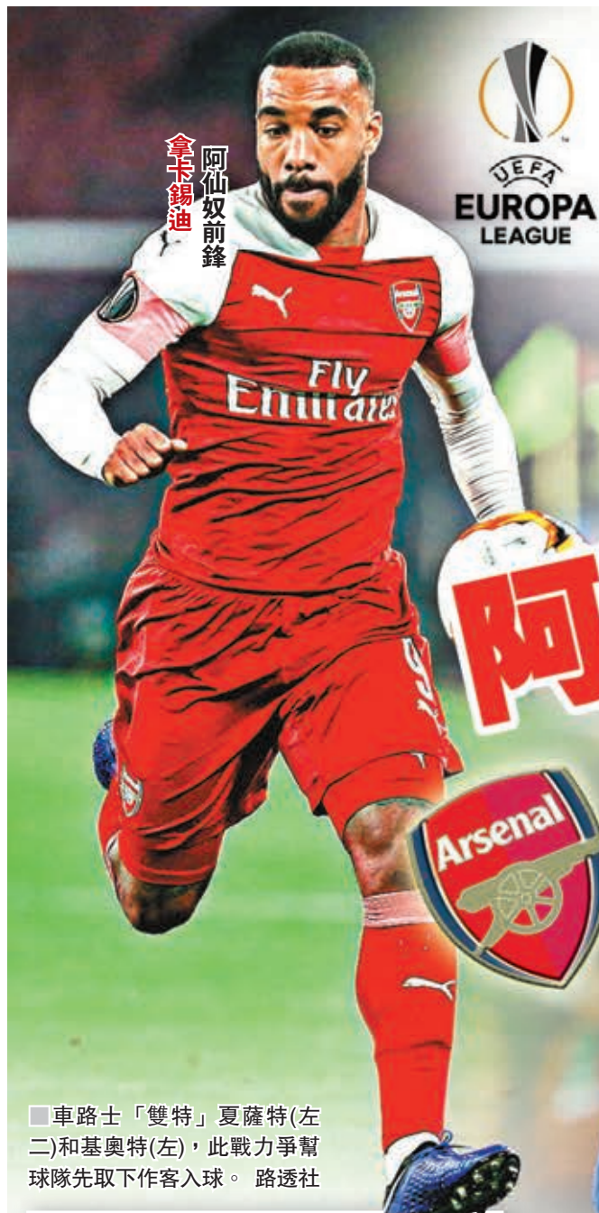
阿仙奴前鋒 拿卡錫迪