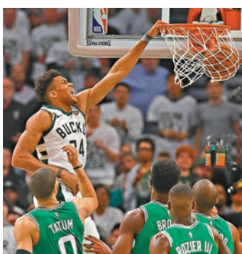
阿迪圖尼保入樽得分。

距，提前鎖定戰局。上仗在內線遭到嚴防的「字母哥」阿迪圖尼保今仗找回自我，攻下29分及10籃板。勇士5名先發球員連續兩場比賽得分上雙，包括史提芬居里，雖然他今仗開賽不久左手中指脫臼，但受傷後迅速返回球場，全場拿下20分。火箭核心夏頓在居里受傷後左眼也被戳傷，縱攻下全隊最高的29分，但在場上仍一直瞇眼和揉眼睛。 中央社