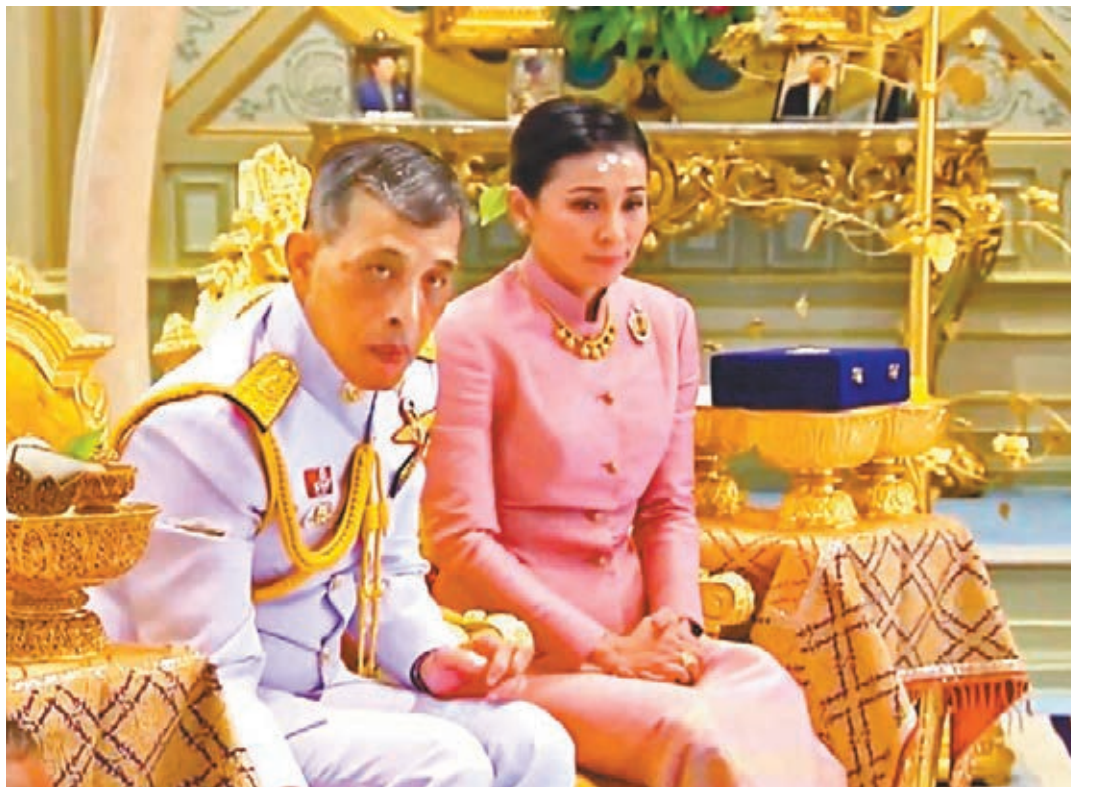
泰媒播放哇集拉隆功與素提達舉行結婚儀式的片段，但未有提及確實日期。