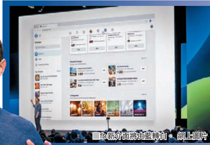
fb新介面將由藍轉白。網上圖片