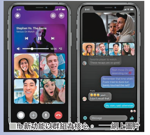
fb新功能以群組為核心。網上圖片