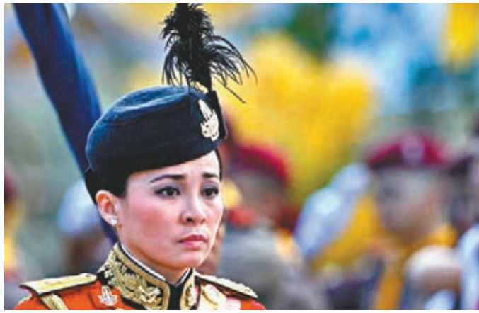
素提達2013年加入王室衛隊。

起在全國發起「志願精神」計劃，號召民眾成為王室義工。這項活動至今已最少有500萬人參與，成為民眾在新泰王名義下履行公民服務最普遍的方式。如早前推舉烏汶叻公主參選總理的反對黨護國黨，黨魁蓬帕尼亦於上週稱「為向泰王表忠」而報名成為義工。義工通常頭戴藍色鴨嘴帽，頸上戴黃色領巾，近日登基儀式在即，義工便着手粉飾道路，如在曼谷街頭掛上蘭花花園，在董里府南部種植紅樹