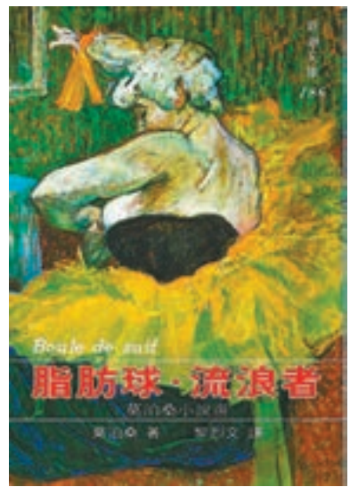
莫泊桑足以傳世的小說。