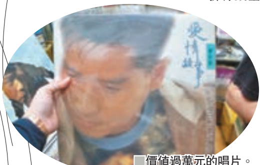
價值過萬元的唱片。