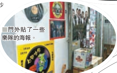
門外貼了一些樂隊的海報。