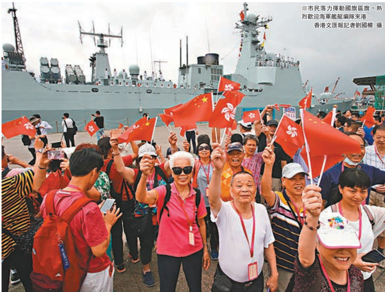
市民落力揮動國旗,熱烈歡迎海軍艦艇編隊來港。