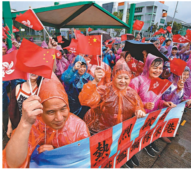
雖然昨日一度下起滂沱大雨,但無阻市民熱情。