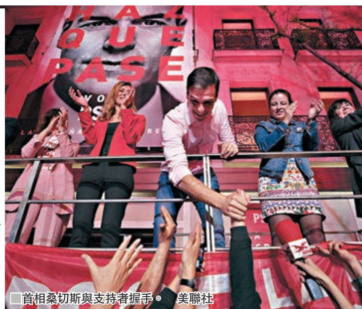
首相桑切斯與支持者握手。