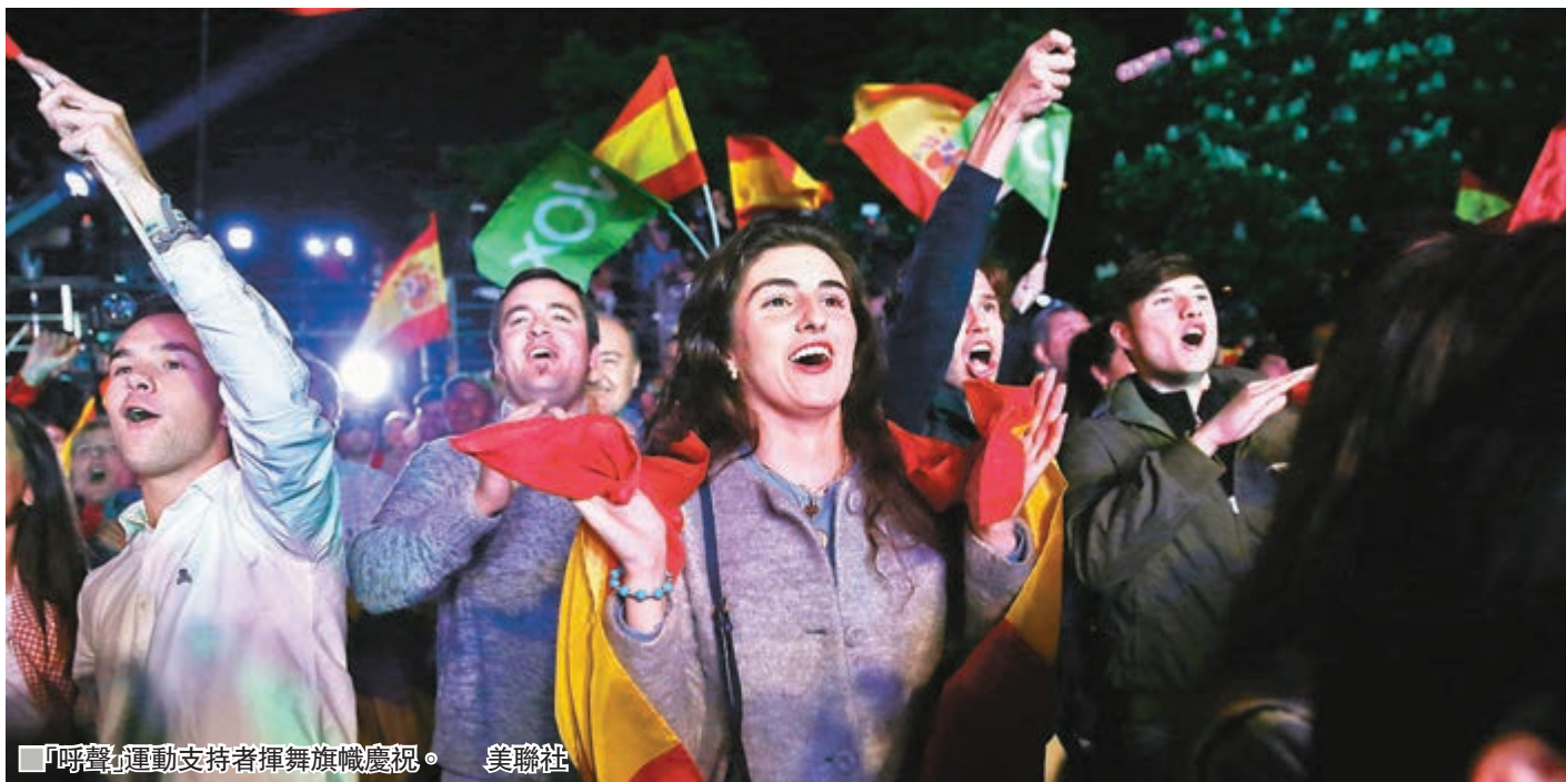
「呼聲」運動支持者揮舞旗幟慶祝。