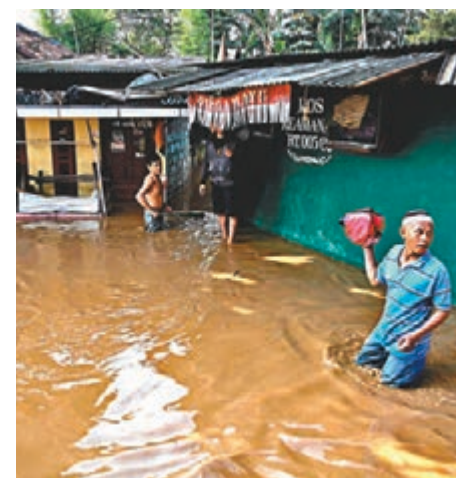
雅加達經常發生洪水、火山爆發或地震等天災。