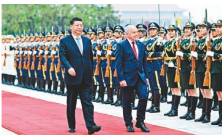
■會談前，習近平在人民大會堂東門外廣場為毛雷爾舉行歡迎儀式。