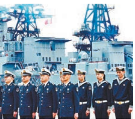
■中國海軍官兵在青島大港碼頭列隊歡迎俄方軍艦。

登臨檢查、聯合防空等課目展開演練。演習開幕式也在同日下午舉行，中方總導演、海軍副司令員邱延鵬宣佈演習開幕，聯合導演部隨後向中俄參演兵力下達演習任務。此外，中俄海軍參演官兵當日下午還進行了艦艇互訪活動。