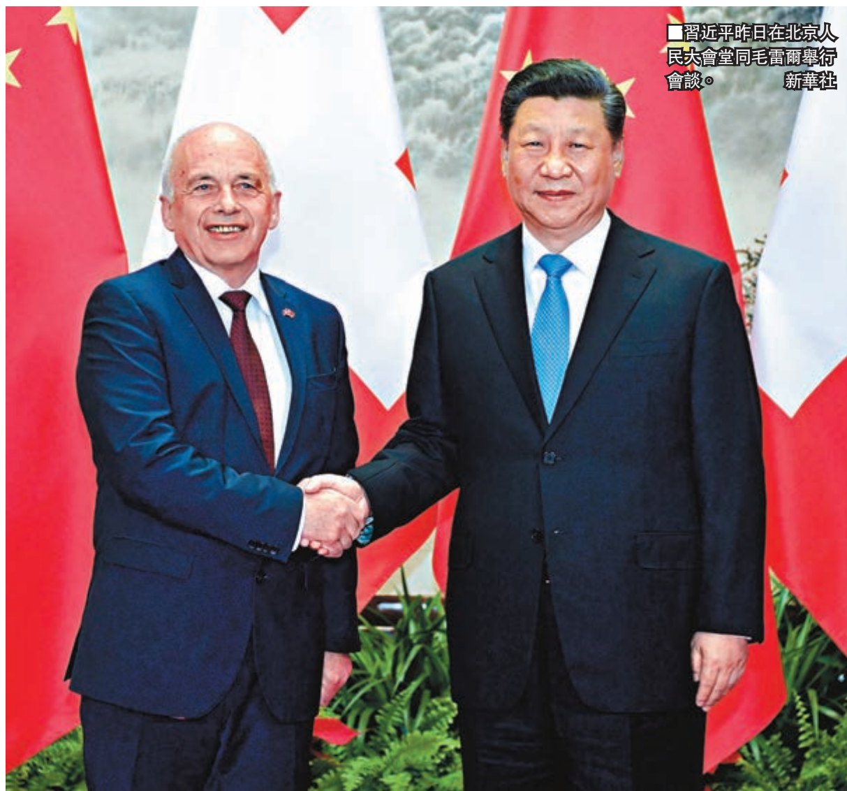
■習近平昨日在北京人民大會堂同毛雷爾舉行會談。

毛雷爾祝賀中華人民共和國成立70周年，表示過去70年來，瑞中交流互鑒，相互了解日益加深，兩國關係發展得很好。瑞中人民都具有勤勞、可靠、創新的品質，這是我們關係深入發展的堅實基礎。2017年習近平主席訪問瑞士並在達沃斯世界經濟論壇年會上發表了重要