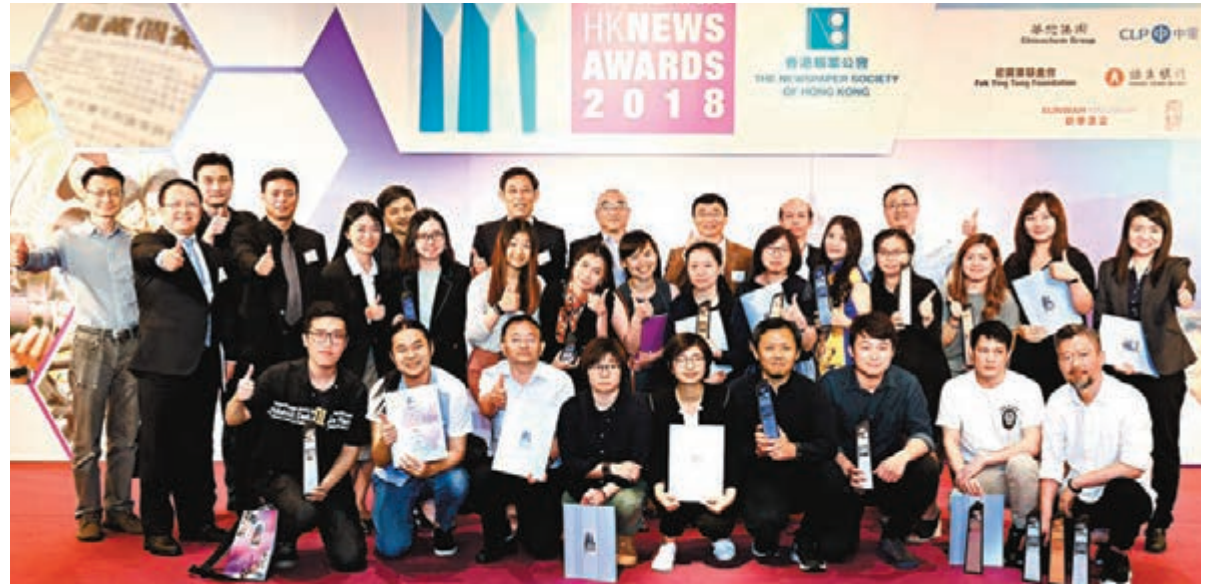
香港報業公會主辦的「香港最佳新聞獎2018」昨日舉行頒獎禮，香港大公文匯傳媒集團旗下兩份報章共獲15個獎項。