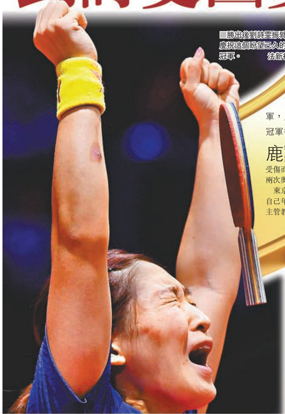
勝出後劉詩雯振臂歡呼，慶祝這個盼望已久的世界冠軍。