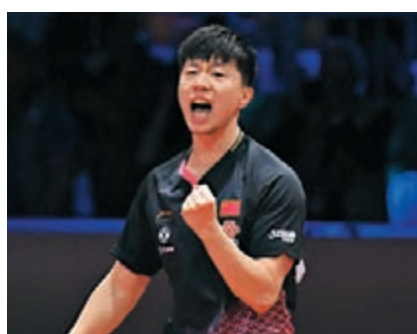
馬龍挫法爾克，世乒賽男單三連冠。

香港文匯報訊(記者郭正謙)世界乒乓球錦標賽馬龍男單三連冠!狀態大勇的馬龍決賽面對瑞典球手法爾克未有遇上太大考驗，以局數4:1輕鬆勝出實現世錦賽男單三連冠，追平國乒名宿莊則棟的歷史紀錄。至於女雙決賽，國乒組合孫穎莎/王曼昱以2:4不敵日本女將伊藤美誠與搭檔早田希娜。