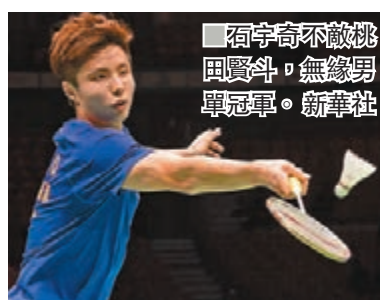
石宇奇不敵桃田賢斗，無緣男單冠軍。