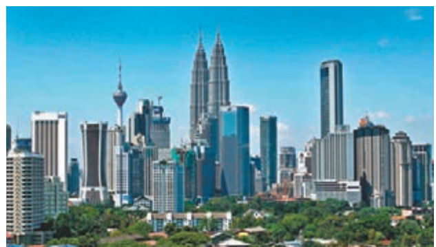
學習新興市場的語言不可或缺，如果學生可以在踏入社會前裝備好自己，自然有更多工作機會。圖為馬來西亞吉隆坡市容。 資料圖片

「帶路先鋒」已連續三屆主辦「一帶一路·與我何干」香港校際綜合能力比賽，旨在年青一輩中推廣「一帶一路」倡議，而得獎學生可以前往「一帶一路」沿線國家訪問，實地考察當地企業、以至當地發展前景等，擴闊同學的眼界，讓他們對未來的出路多一個選項。