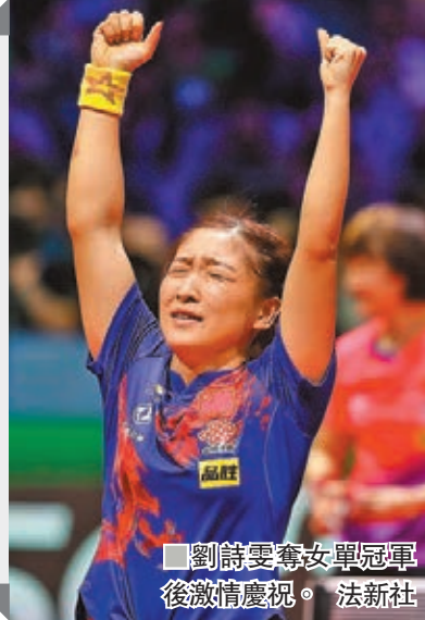
劉詩雯奪女單冠軍後激情慶祝。

經驗與活力兼備的「馬王配」未能得到太多機會，局數戰成1：1下被對手連下三城，最終馬龍/王楚欽以4：1勝出勇奪男雙金牌。 而女子方面則由劉詩雯搶盡風頭。這名28歲的球手先於混雙夥拍許昕先奪一金，其後在女單決賽面對隊友陳夢，先輸一局下反勝4：2，獲得個人首面世錦賽女單金牌。勝出後她丟掉球拍振臂歡呼，慶祝期待已久的世界冠軍。