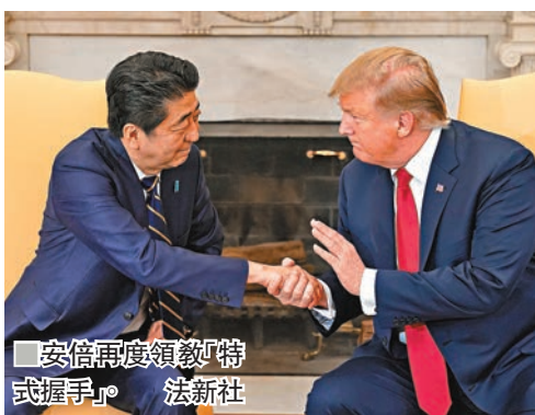
■安倍再度領教「特武握手」。

日本經濟再生擔當相茂木敏充強調，任何與美國達成的協議，均需取得美國國會批准，被指是反駁特朗普指談判進展迅速的言論，認為華府需作出重大讓步，才能換取日本開放農產品市場。