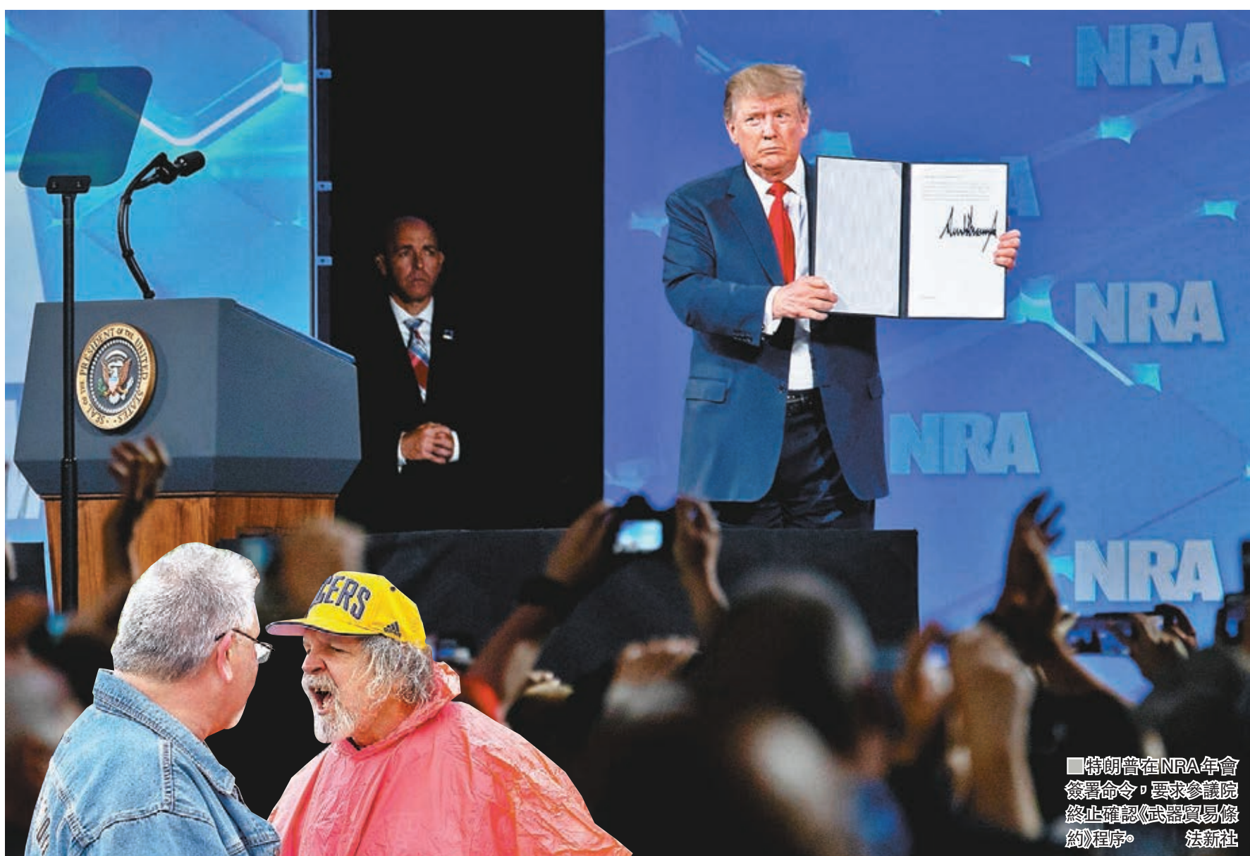
■特朗普在NRA年會簽署命令，要求參議院終止確認《武器貿易條約》程序。