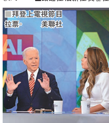
■拜登上電視節目拉票。

另一方面，拜登競選團隊前日表示，拜登在宣佈參選後首24小時，已在網上籌得630萬美元(約4,940萬港元)競選經費，以參選首天而言，是民主黨所有參選人中最多，當中61%捐款來自新的捐款人。