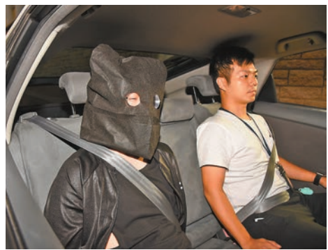
警方破獲5,800萬元可卡因毒品案,拘捕兩名本地男子。