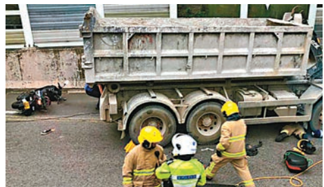
消防員趕至現場拯救被困車底的鐵騎士。

另於傍晚6時許,一輛電單車沿屯門公路駛往屯門方向,至青山青榕街附近時,突失控翻車,姓石,27歲鐵騎士疑拋飛撞路中石壘,身體多處受傷昏迷,有尾隨車輛見狀立即停車報警,稍後石由救護車送院急救,延至6時48分終不治。警方事後封閉路面調查。案件交由新界北總區交通部特別調查隊跟進。並呼籲任何人如目睹意外發生或有任何資料提供,請致電3661 3800與調查人員聯絡。