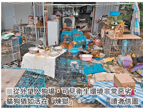
從外望入狗場,可見衛生環境非常惡劣,貓狗猶如活在「煉獄」。