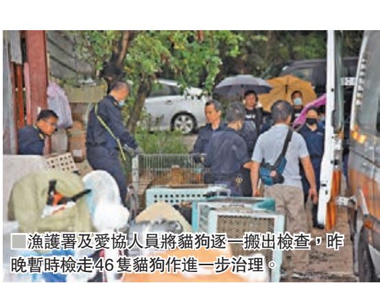
漁護署及愛協人員將貓狗逐一搬出檢查,昨晚暫時檢走46隻貓狗作進一步治理。

昨晨10時許,再有動物義工到狗場要求進內看望動物被拒,於是報警,並將事件上載至香港動物報facebook專頁。警方、漁護署及愛護動物協會人員到場調查,但遭場主阻止進入而發生對峙,更有在場採訪電視台記者的器材被場主毀