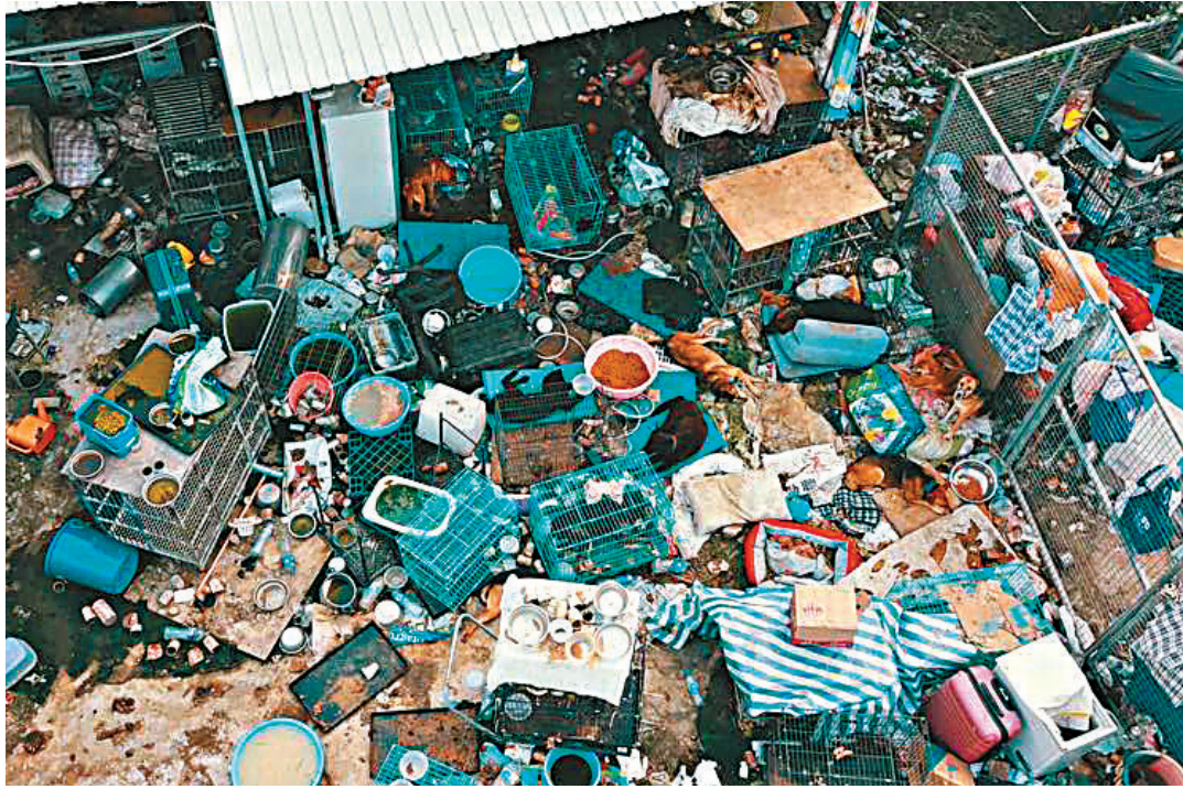
從高空偵察所見,狗場內衛生環境非常惡劣,四處隱約可見懷疑狗隻屍體,猶如「亂葬崗」。

香港文匯報訊(記者 蕭景源、劉友光)正當政府倡議將虐待動物刑罰加重至可判囚10年,昨打鼓嶺坪峯一個專收留流浪貓狗的狗場,被揭發懷疑殘酷虐待動物案。近日有動物義工因場主拒絕他進入探望流浪貓狗,並在門外草叢發現有動物屍體;義工思疑下,昨日利用航拍機進行高空偵察,發現場內衛生環境惡劣、四處佈滿動物屍體,於是報警。警方、漁護署及愛協人員到場救出近百隻缺水缺糧的貓狗,場主被捕扣查。