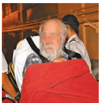
伴屍老翁身心虛弱送院。

警員封鎖現場調查,滿頭白髮及白鬚的黃翁因心欠佳兼身體虛弱,要由救護車送往聯合醫院治理。警方調查後暫