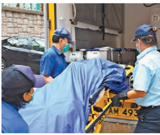
死去約一個月的老婦遺體昇送殮房待驗死因。

未能確定黃婦死因,稍後將遺體昇送殮房待驗以證死因。送院後需留醫的黃翁則涉嫌非法處理屍體被捕,並通知社署跟進。