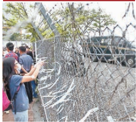
大聯盟促請政府盡快將庇利街停車場設定為旅遊巴士專用停車場。

他促請警方加強執法,打擊違例泊車及違規上落客情況,並建議政府善用可停泊120部旅遊巴士的庇利街停車場,用作旅客的上落客專區,減少旅客停留街上造成阻塞的機會。至於中長期改善措施,則應將遊客分流至新田購物城等旅遊區,透過重整行程疏導旅客,以及檢