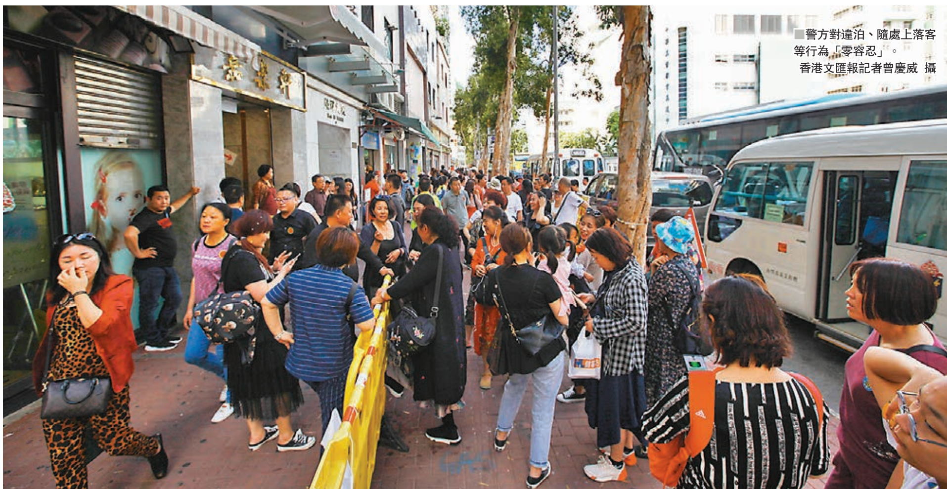
警方對違泊、隨處上落客等行為「零容忍」。

香港文匯報訊(記者 高俊威)內地即將展開一連四天的五一勞動節假期,預料屆時訪港團按年激增五成、每日逾300團,為香港帶來可觀的經濟收益,同時或曝露本港旅遊規劃失衡問題。毗鄰「維港遊」上落客點的土瓜灣更被迫爆,在人車爭路下,早前土瓜灣更有路人魂斷旅遊巴士下。警方、運輸署及旅遊業嚴陣以待迎接新一輪的旅客潮,警方對違泊、隨處上落客等行為「零容忍」,不再事先警告,直接票控旅遊巴士。