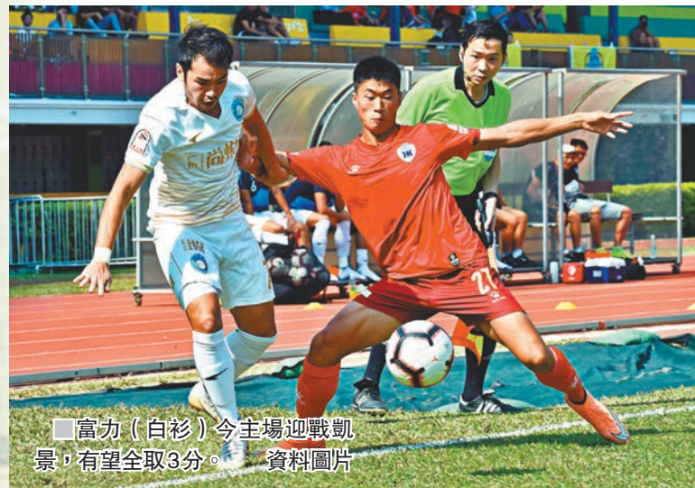
富力(白衫)今主場迎戰凱景，有望全取3分。

按目前聯賽榜形勢，凱景比多賽一場的理文少7分，意味着餘下3場必須全取9分，才有望保留港超席位。然而要一支包尾大埔作客戰勝標榜分子富力R&F，機會可謂極度渺茫。