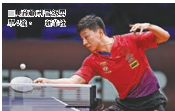
馬龍順利晉級男單4強。

六度出戰世錦賽卻從未染指過女單冠軍，劉詩雯終於再次迎來登頂機會：「落後0:2時我沒有退路了，我知道再這樣打下去不行，必須更加專注、更沉着應戰，這可能是我最後一次參加世錦賽，希望不會留下任何遺憾。」劉詩雯女單決賽的對手將是陳夢，後者以4:0輕取王曼昱晉身決賽。