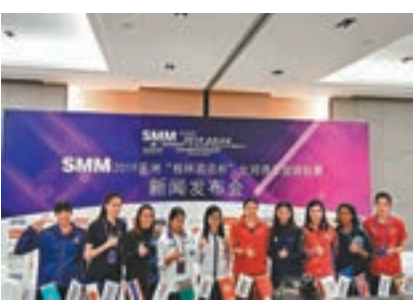
女排亞俱盃參賽隊伍代表昨在津亮相。

香港文匯報訊(記者 張聰 天津報道) 2019年亞洲俱樂部女子排球錦標賽(亞俱盃)4月27日至5月5日在天津揭幕，東道主天津女排在家門口向著俱樂部歷史上第五座亞俱盃冠軍獎盃發起衝擊。根據賽程安排，天津女排首場迎戰中國香港隊。天津女排主教練陳友泉在接受本報記者採訪時表示，儘管有三位隊員尚未歸隊，但天津女排