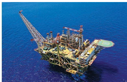
赫斯基能源在南中國海的项目。

香港文匯報訊 長和旗下赫斯基能源昨公佈今年首季業績,營運所得資金為9.59億加元,較前季上升64%;盈利淨額為3.28億加元,較前季上升52%;每股派息0.125加元;其中於南中國海的業務持續進展良好,增長強勁。