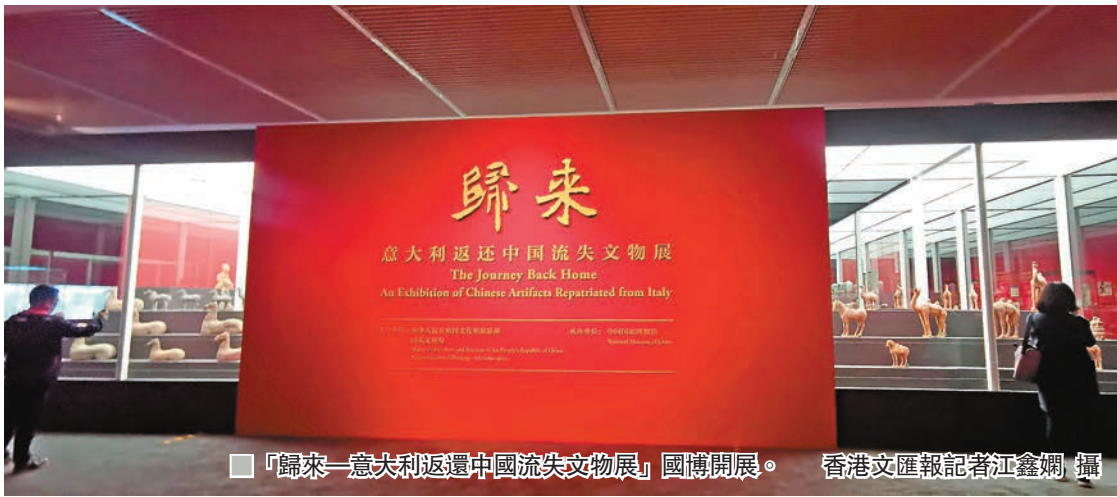
「歸來—意大利返還中國流失文物展」國博開展。

香港文匯報訊（記者 江鑫嫻 北京報道）新石器時代馬家窯文化四大圈紋雙耳彩陶壺、西漢彩繪繡形陶壺、唐代彩繪陶駱駝、宋代白釉刻花碗、明代綠釉陶床……由文化和旅遊部、國家文物局聯合主辦的「歸來—意大利返還中國流失文物展」昨日在中國國家博物館開幕。展覽從此前由意大利返還的796件中國文物藝術品中選出700餘件，免費向公眾展出，展覽將持續至6月30日。文化和旅遊部部長雒樹剛在開幕式上表示，此次文物返還，是中國流失文物追索返還工作中歷時最長的案例，也是近20年來最大規模的中國流失文物回歸。