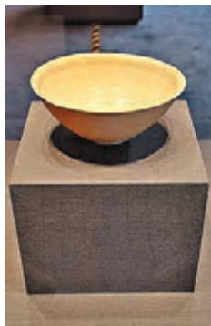
白釉刻花碗 宋 (公元960年~1279年)