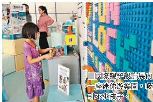
■國際親子設計展內一座迷你遊樂園，吸引不少孩子。