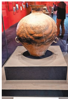
四大圈紋雙耳彩陶壺 新石器時代馬家窯文化 (公元前3800~前2050年)