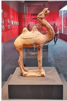
彩繪陶駱駝 唐 (公元618年~907年)