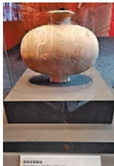
彩繪繡形陶壺 西漢 (公元前202年~公元8年)