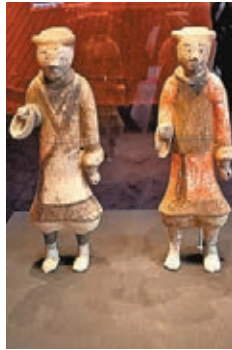
彩繪陶俑 西漢 (公元前202年~公元8年)