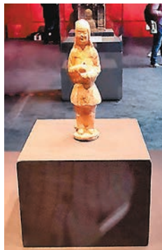
黃釉武士陶俑 唐 (公元618年~907年)