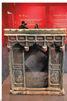
綠釉陶床 明 (公元1368年~1644年)