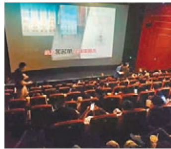
■《復聯4》播放前大屏幕出現「老賴」名單。