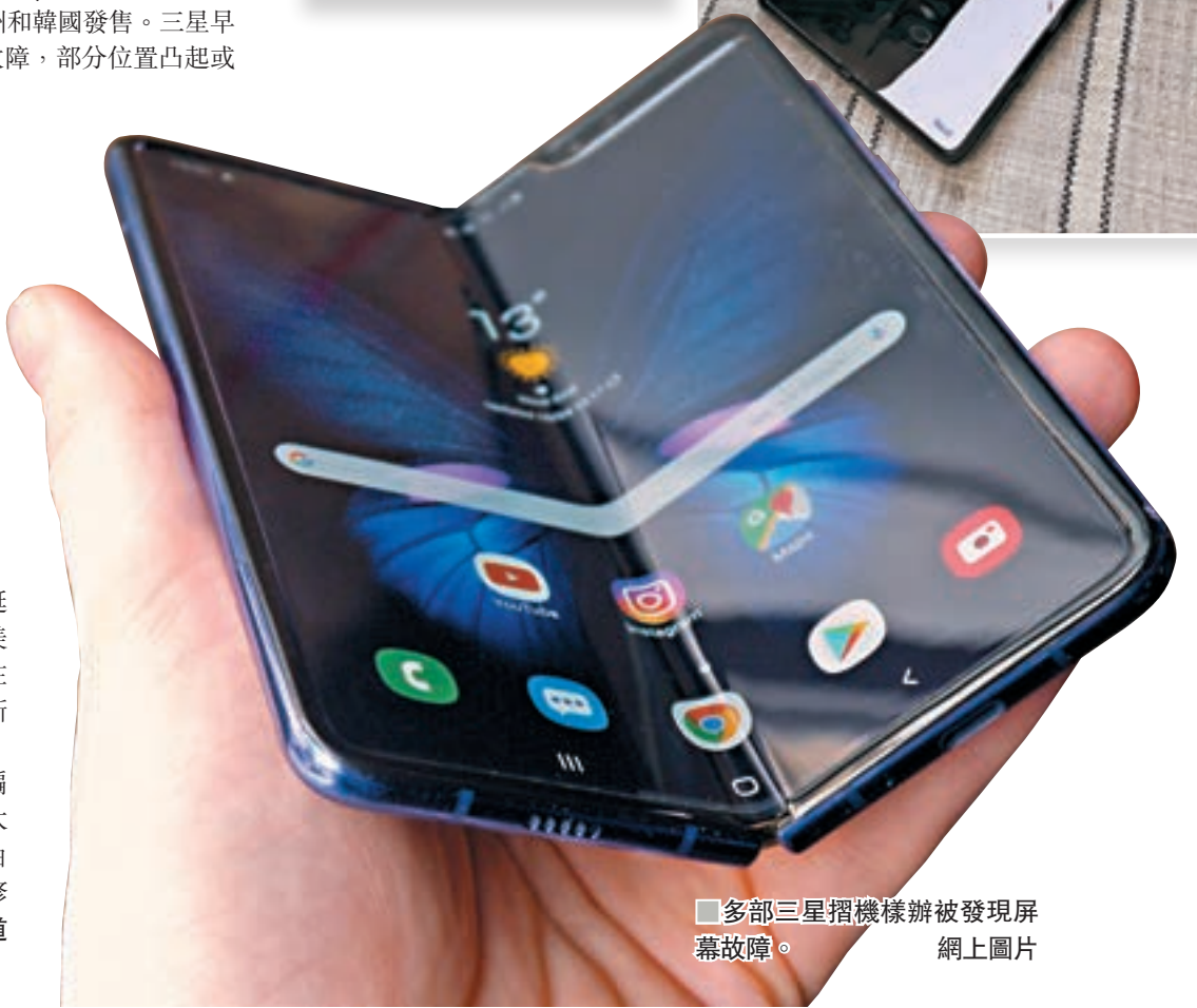
多部三星摺機樣辦被發現屏幕故障。網上圖片