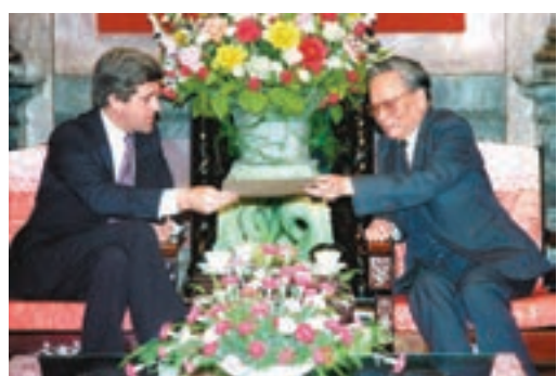
黎德英與時任美國參議員克里會面。資料圖片