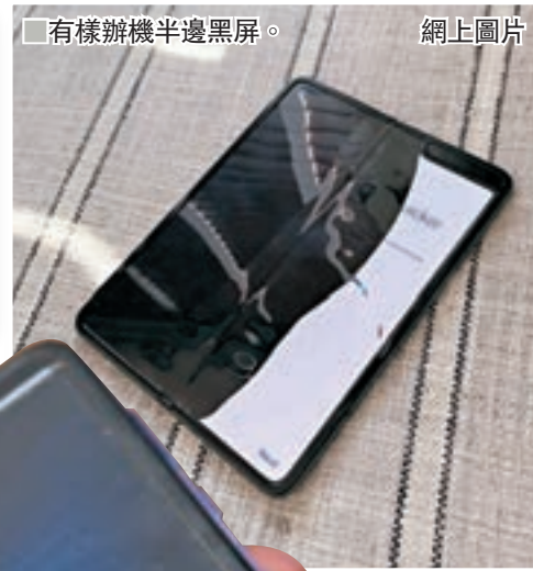
有樣辦機半邊黑屏。