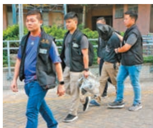
專爆竊長者單位青年被黑布蒙頭拘捕帶署扣查。

定期進行減罪宣傳活動，包括提醒長者記得鎖好門窗防盜及小心街頭騙案等，但年長居民容易忽略，稍後將會再加強有關防盜防騙宣傳工作。 洪錦鉉察覺寶達邨在保安方面，有可再加強空間及需要；如邨內有多幢大廈地下設有前後門，但保安員主要留意正門出入，較難監察後門情況，另有大廈設有停車場，停車場由領展負責管理，但屋苑則由有房委會管理，容易讓不法之徒潛入大廈。