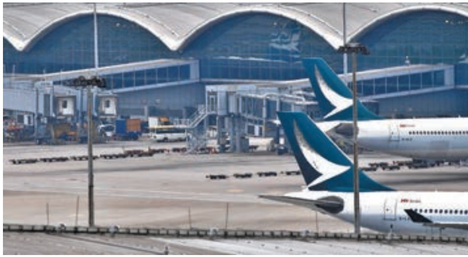
國泰兩嚴重事故受查。資料圖片

其中一宗事故發生於今年1月26日，一架國泰航空波音777-367型飛機，從日本新千歲機場開往香港國際機場。當晚大約香港時間晚上10時，機長在台北飛行情報區向西航行途中突然失去正常視力，情況持續約30分鐘。機長將情況告知副駕駛員，並向副駕駛員及機艙服務經理表示他將交出飛機的指揮權。 機長留在原位，將座位調校至完全向後，然後自行綁上座椅安全帶及鎖定肩帶，以免阻礙飛機操作。隨後他指示機艙服務經理致電醫療諮詢服務尋求建議，又指示副駕駛員向國泰的綜合運作中心匯報情況。