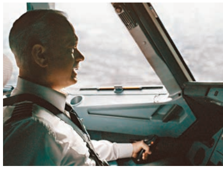
機師突失視力仍飛半個鐘。圖為《薩利機長：迫降奇蹟》劇照。

香港文匯報訊(記者 文森)民航意外調查機構昨日公佈兩宗機長在航程中因身體不適，無法執行操縱飛行員職務而需由副駕駛員「頂上」的事故。兩宗事故都涉及國泰航空機長，兩機最後有驚無險降落香港國際機場，其中一宗事故的機長，駕駛期間失去正常視力長達半小時，並由副駕駛員接力操控飛機。