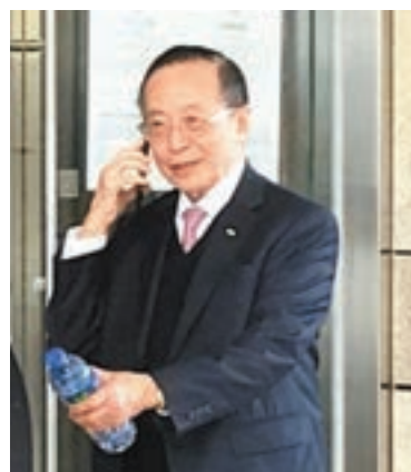
潘樂陶被控非法僭建罪成，判處罰款兩萬元。