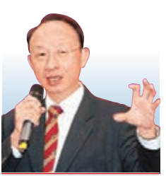
黎偉成 資深財經評論員